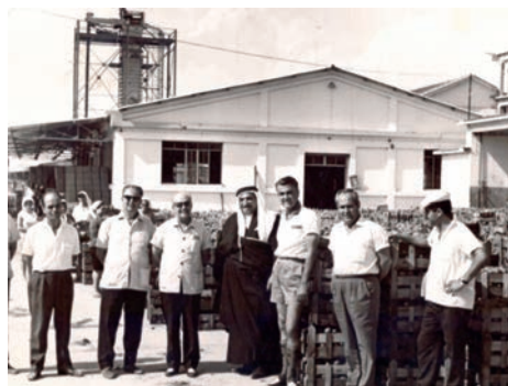
Εργοστάσιο Ε.Γ.Σ. Λαγκαδά, 1955.

Οι Λαγκαδιανοί ζούσαν μια ήρεμη καθημερινότητα και ο ημερήσιος αγώνας ξεκινούσε από το πρώτο ορθρινό χτύπημα της καμπάνας και τελείωνε με το τελευταίο του εσπερινού. Η καμπάνα ήταν το ρολόι που καθόριζε τα όρια της ζωής των ανθρώπων. Τότε ακόμα και τα ζώα θα επέστρεφαν από τη βοσκή και τα κάρα θα έφερναν πίσω τους κουρασμένους αγρότες από την πάλη με τη γη και το χώμα της, ή τους ψαράδες από τον γαλάο. Κάθε φορά που ακουγόταν ο χτύπος της, σταματούσε η εργασία, άφηναν κάτω τις αξίνες ή τα εργαλεία τους, έβγαζαν το καπέλο τους και έκαναν ευλαβικά το σταυρό τους. Μόλις έπαιρνε να σουρουπώνει τα καφενεδάκια της πόλης γέμιζαν με πελάτες, ενώ έξω από τις αυλόπορτες των σπιτιών ο γυναικείος πληθυσμός θα ξεκινούσε το δικό του πρόγραμμα αλληλοενημέρωσης, το γνωστό σε όλους «μουχαμπέτι»! Θέματα των συνάξεων η «κοινωνική κριτική» ή τα σχόλια στη μοναδική τότε εφημερίδα της πόλης την ΦΩΝΗ ΤΗΣ ΕΠΑΡΧΙΑΣ ΛΑΓΚΑΔΑ του αείμνηστου Νίκου Μουλά, ο οποίος ασχολούνταν με ιστορικά και λαογραφικά θέματα αλλά και με ντόπια «χωρατά και μασάλια», όπου συντηρούσε με τον τρόπο του και την ντοπιολαλιά της πόλης.