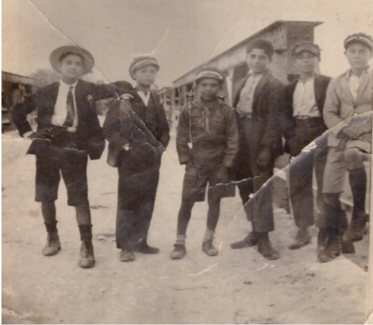
Βόλτα στη γέφυρα, 1934.