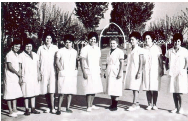
Εργαζόμενες στα λουτρά του Λαγκαδά.