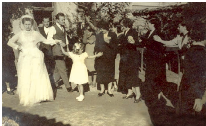
Ο χορός της νύφης, 1955.

Καθ' όλο αυτό το διάστημα το γλέντι γίνεται στην αυλή. Όταν έρθει ή ώρα να ξεκινήσουν για την εκκλησία, βγάζουν τη νύφη στην αυλή για να δωρίσει στους συγγενείς της. Όλοι οι συγγενείς της περνούν με τη σειρά και της δίνουν φιλοδώρημα. Αυτή τους φιλάει το χέρι και βάζει στον δεξιό ώμο του καθενός από μια πετσέτα άσπρη υφαντή. Με αυτές τις πετσέτες στους ώμους μπαίνουν στο χορό. Κατά τη διάρκεια των δωρισμάτων τα όργανα παίζουν λυπητερά τραγούδια.