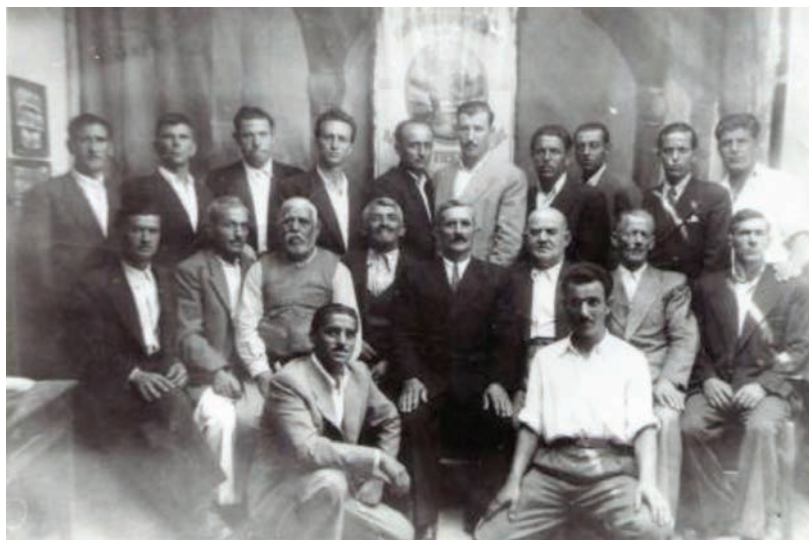
Οι αμαξοκαροποιοί του Λαγκαδά στα 1946.