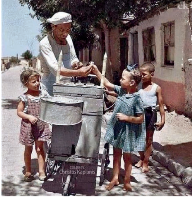
Πλανόδιος παγωτατζής, 1960.