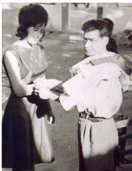
Τα δωρίσματα της νύφης και του πεθερού.

Καθ' όλο αυτό το διάστημα το γλέντι γίνεται στην αυλή. Όταν έρθει ή ώρα να ξεκινήσουν για την εκκλησία, βγάζουν τη νύφη στην αυλή για να δωρίσει στους συγγενείς της. Όλοι οι συγγενείς της περνούν με τη σειρά και της δίνουν φιλοδώρημα. Αυτή τους φιλάει το χέρι και βάζει στον δεξιό ώμο του καθενός από μια πετσέτα άσπρη υφαντή. Με αυτές τις πετσέτες στους ώμους μπαίνουν στο χορό. Κατά τη διάρκεια των δωρισμάτων τα όργανα παίζουν λυπητερά τραγούδια.