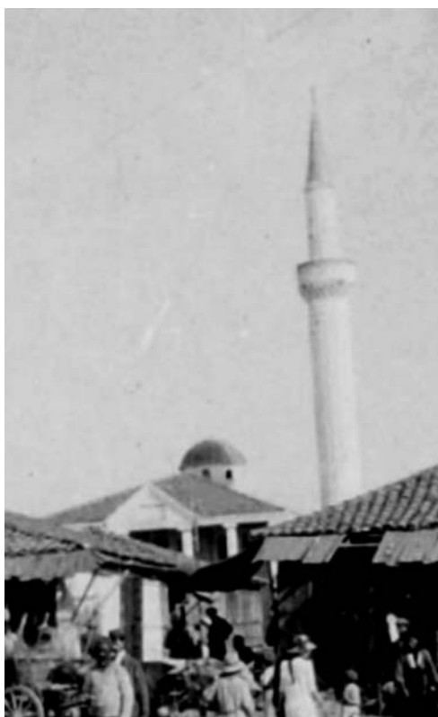
Η αγορά του Λαγκαδά, 1917.

Όταν έχεις έναν υψίστης σημασίας και αξίας πολιτισμό, έναν ιλιγγιώδη πλούτο πολιτισμικών δρωμένων σε κάθε έκφραση της ζωής σου και μια παράδοση που τροφοδότησε γενιές και γενιές σε καιρούς δύσκολους για το γένος, γιατί δίδασκε ήθος και ενότητα, δεν μπορείς να καυχέσαι γιατί κάνεις ό,τι κάνουν οι Γερμανοί και οι Κογκολέζοι τις ίδιες ημέρες του χρόνου με παρόμοια αισθητική και λογική. Αφήνουμε την σίγουρη τροφή του γένους και τρέφουμε τα παιδιά μας με τα ξυλοκέρατα ενός αμφίβολου πολιτισμού. Στην ελληνική παράδοση αξία έχει ο πολιτισμός γιατί ακριβώς σέβεται την αξία του ανθρώπινου προσώπου και την εμπειρία του.