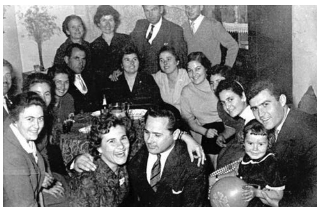
Οι αρραβωνιασμένοι με τους φίλους τους.

Πάνω σε ένα τραπέζι του σπιτιού βρίσκεται η κανδήλα, μια εικόνα της Παναγίας ή του Χριστού, κουφέτα και οι βέρες του αρραβώνα δεμένες με μια κορδέλα. Σε κάποιες περιπτώσεις που ήθελαν να δώσουν επισημότητα καλούσαν και τον παπά για να ευλογήσει τις βέρες και να εγγυηθεί με την παρουσία του για τον αρραβώνα. Κάποιος από τους φίλους του γαμπρού ή ο νουνός του αναλαμβάνει να τους φορέσει τις βέρες αφού τις σταυρώσει πάνω στην εικόνα. Σε σπίτια με χριστιανικές καταβολές έλεγαν και μια προσευχή, συνήθως το «Πάτερ ημών». Στη συνέχεια οι γονείς των αρραβωνιασμένων ασπάζονται τα παιδιά τους και τους κρεμούν από ένα χρυσαφικό ή μια λίρα.