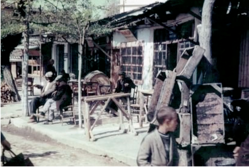
Μέρος της αγοράς του Λαγκαδά 1945.