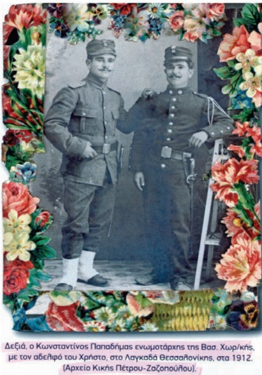
Ο αστυνομικός διοικητής Λαγκαδά, 1912.