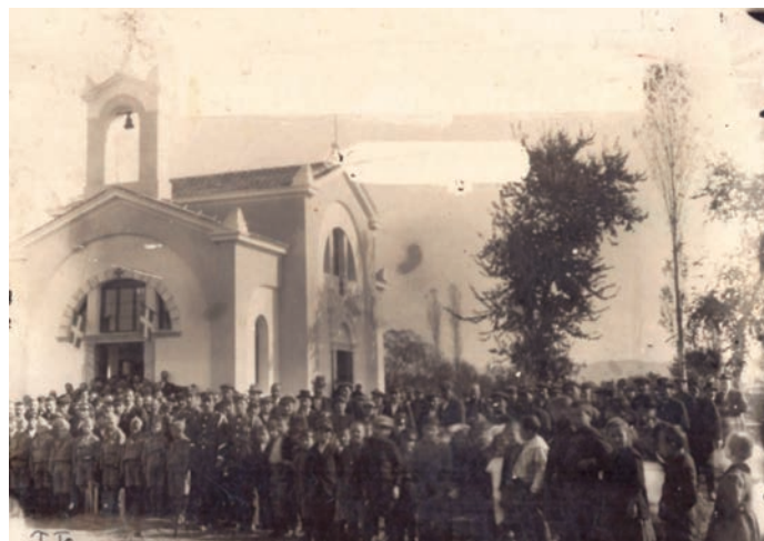
Ναός αγίου Κωνσταντίνου και Ελένης στο Λαγκαδά.