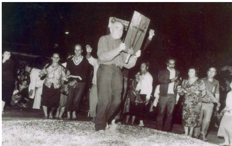
Πυροβασία στην πλατεία Αναστεναρίων.

τον αρχιαναστενάρη τον οποίον ακολουθούν όλοι κατά σειρά και κατά αρχαιότητα, κάνει τον πρώτο γύρο γύρω από τη φωτιά και πρώτος αυτός εισέρχεται, οιστριλατούμενος και με οργιαστικό ενθουσιασμό πατεί πάνω στην πυρά και δίνει το σύνθημα της ενάρξεως της πυροβασίας. Τον ακολουθεί όλη η ομάδα των αναστενάρηδων με τον ίδιο ενθουσιασμό, φωνάζοντας αχ..αχ..ιχ..ιχ κρατώντας τις εικόνες ή κόκκινα μανδήλια στα χέρια και ορμώντας με πάθος πάνω στην ανθρακιά, ενώ ο ήχος των οργάνων επιτείνει με τον ρυθμικό και μονότονο μουσικό μοτίβο τον εκστασιασμό τους. Όταν πια ο αρχιαναστενάρης δώσει το σύνθημα της αποχώρησης, αποχωρούν με τον ίδιο λιτανευτικό τρόπο, προηγούμενων λαμπάδων, θυμιατών και των οργάνων.