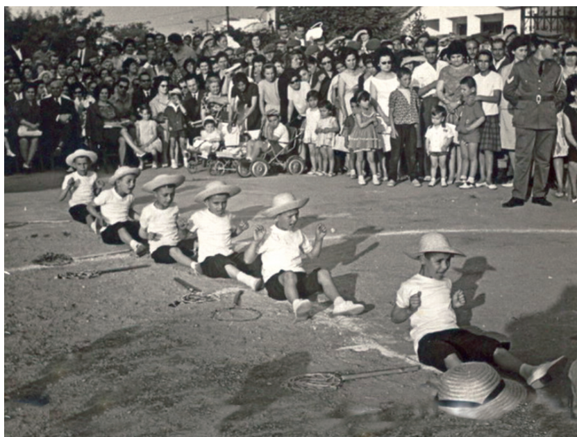
Γυμναστικές επιδείξεις στο Α' Δημοτικό Σχολείο, 1963.