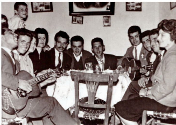
Αποκριάτικο γλέντι νεολαίας.