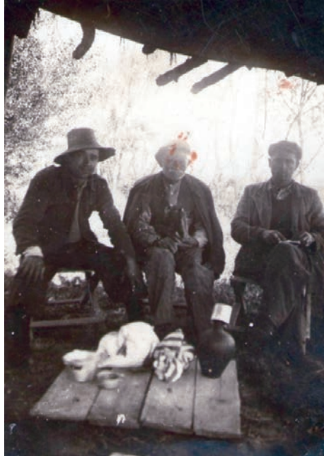
Οι Βενιώτιδες κατασκευαστές καραβιών, στο καρνάγιο τους.