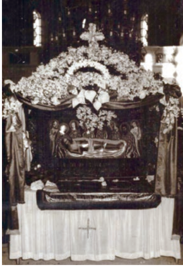
Ο επιτάφιος της αγίας Παρασκευής στα 1946.

Γύρω από το σταυρό οι γυναίκες έψαλλαν το μοιρολόγι της Παναγιάς «σήμερα μαύρος ουρανός, σήμερα μαύρη μέρα» και όλες μαζί έβλεπες να κλαίνε και να σταυροκοπιούνται. Υπήρχαν βέβαια δύο-τρεις καταξιωμένες μοιρολογίστρες που είχαν πάντα τον πρώτο λόγο στο μοιρολόγι αλλά πλαισιώνονταν και από άλλες γυναίκες κι έτσι γινόταν ένας μικρός χορός φαλτριών γύρω από τον Σταυρό ψάλλοντας: