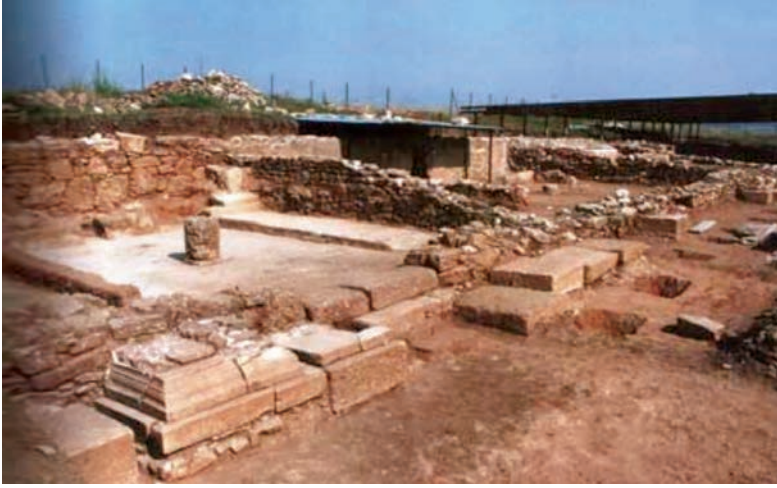
Ο αρχαιολογικός χώρος των Καλινδοίων.

Στην περιοχή μας λοιπόν καταγράφονται οι εξής αρχαιολογικοί χώροι καθώς και άλλοι χώροι που έχουν να κάνουν με την ναοδομία και την μεταβυζαντινή τέχνη. Ας τους γνωρίσουμε λοιπόν: