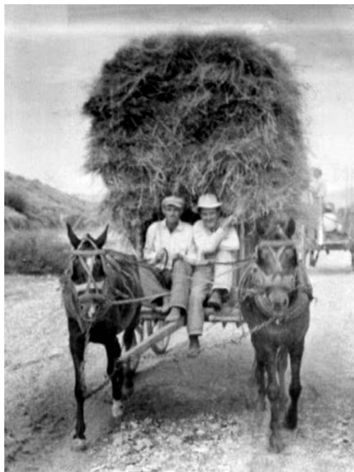
Η μεταφορά των χόρτων.