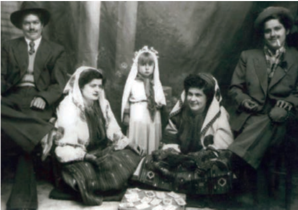
Αποκριές του 1950.

Τώρα έσβησαν αυτά όλα, έσβησε ακόμα και το ήθος της σαρακοστής και του καρνάβαλου. Τότε οι αποκριές, που συνδέονταν με τις μεταμφιέσεις και τον καρνάβαλο, ακολουθούσαν εθιμικά αρχαία δρώμενα που ήταν απότοκος παλαιών ειδωλολατρικών παραδόσεων, τα οποία οι άνθρωποι ακολουθούσαν περισσότερο ως στοιχεία μιας αρχαίας ζωής των προγόνων, χωρίς κάποιο ιδιαίτερο πνευματικό περιεχόμενο. Άλλωστε όλα αυτά τα δρώμενα, που συνδέονταν κυρίως με την άνοιξη και την ανθοφορία, είχαν και μια δόση χαράς και ελπίδας για το μέλλον τους. Ο καρνάβαλος τότε είχε μια αθωότητα παιδική, που δήλωνε την ανάγκη της ανθρώπινης φύσης για αλλαγή του προσώπειου για μεταμόρφωση. Τώρα έχει γενικά αλλάξει ακόμα κι αυτός ο λαογραφικός χαρακτήρας που συνέδεε με την αρχαιότητα.