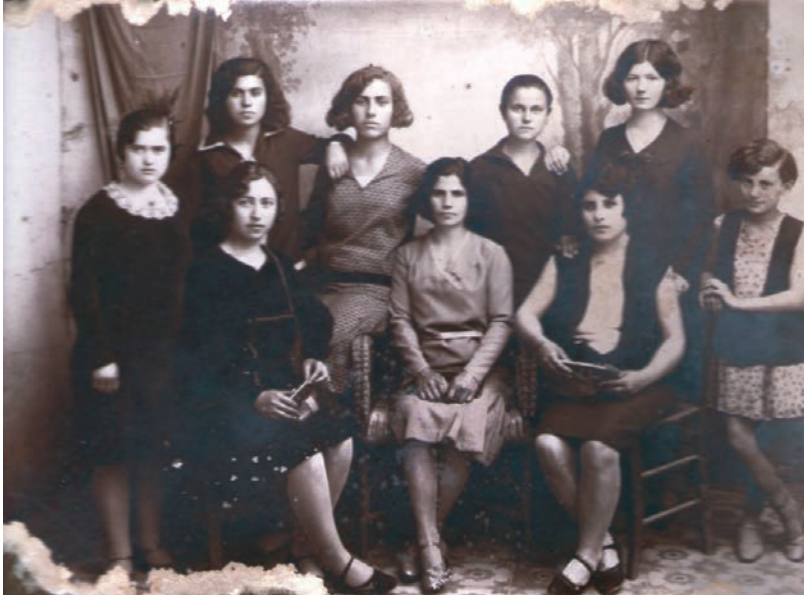
Δασκάλα και μαθήτριες μοδιστρικής τέχνης.