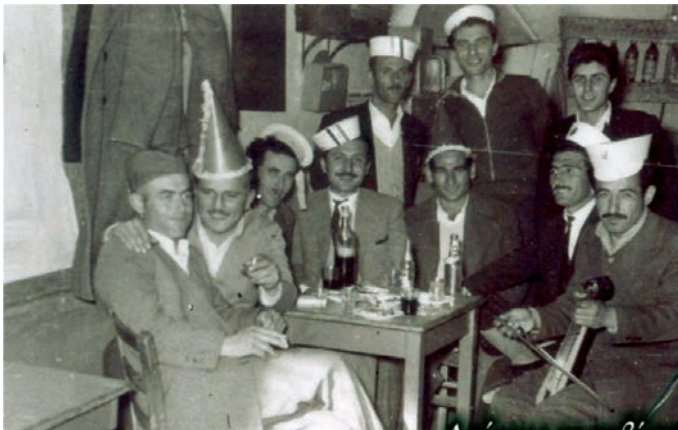
Απόκριες σε ταβέρνα.

Η πόλη είχε μια καλή παράδοση στους κανταδόρους κι έτσι δεν ήταν λίγοι αυτοί που οργάνωναν τα βράδια κάποιες συγκεντρώσεις σε ταβερνάκια ή σπίτια και διασκέδαζαν, με ελάχιστα πράγματα στο τραπέζι, πολύ κρασί και περισσότερο κέφι. Με μια κιθάρα ή ένα ακορντεόν γλεντούσε όλη η γειτονιά, ή άλλοτε πάλι έφεραν κάποιον λατερινατζή και έτσι το κέφι ζωντάνευε περισσότερο. Βέβαια τότε χωριστά γλεντούσαν οι ντόπιοι και χωριστά οι πρόσφυγες, γιατί δεν συμφωνούσαν στα μουσικά γούστα.