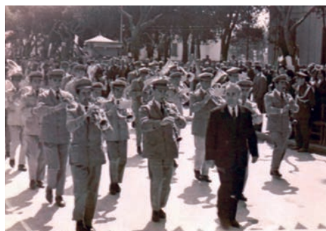
Η παρέλαση 1950.

της εθνικής γιορτής και του Ευαγγελισμού όπου τα πάντα έπαιρναν έναν άλλον χαρακτήρα, θρησκευτικό και εθνικό, καθώς «της σωτηρίας ημών το κεφάλαιον» δηλαδή ο Χριστός, ήταν και ο λυτρωτής του γένους. Έτσι οι γιορτές στα σχολεία και οι παρελάσεις είχαν την τιμητική τους. Ποιήματα, τραγούδια, θεατρικά δρώμενα, αγωνία για το ποιο σχολείο θα παρελάσει καλύτερα, ήταν τα θέματα που απασχολούσαν τα παιδιά και την κοινωνία, γιατί οι μαθητές που θα περνούσαν καλύτερα στην παρέλαση απολάμβαναν την επόμενη μέρα σχολική εκδρομή. Η εικόνα του κάθε σχολείου αντικατοπτριζόταν στην παρέλαση από την φαντασία των δασκάλων να ντύνουν τα παιδιά με ομοιόμορφη στολή παρέλασης ή να τα ντύνουν με παλιές παραδοσιακές φορεσιές που έφεραν αναμνήσεις και συγκίνηση και βέβαια η παρουσία της φιλαρμονικής της πόλης πάντα εντυπωσιακή.