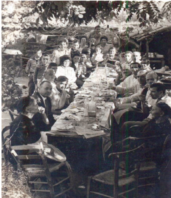
Γαμήλιο γεύμα, 1963.