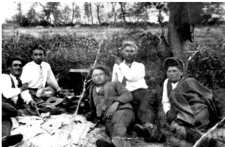
Νεανική παρέα την Πρωτομαγιά του 1937.

Ο Μάιος συνδέονταν μετά το 1942-3 με τα Αναστενάρια και τη γιορτή των αγίων Κωνσταντίνου και Ελένης. Βέβαια πρέπει να πούμε ότι το έθιμο των αναστεναρίων δεν είχε να κάνει με την ντόπια ιστορία και τη λαογραφία της πόλης του Λαγκαδά, δεδομένου ότι πρόκειται για αρχαιοελληνικό-Διονυσιακό έθιμο, Θρακικής προέλευσης, που μεταφέρθηκε στο Λαγκαδά από τους Θρακιώτες πρόσφυγες και καθιερώθηκε περί το 1943 παρά την πρώτη αντίδραση των Γερμανών κατακτητών.