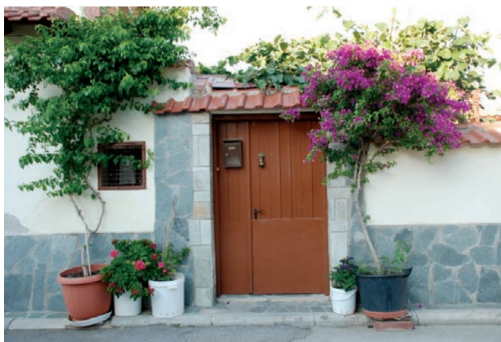
Εξώπορτα στο Λαγκαδά.

Κάπου εδώ τελείωνε το εκκλησιαστικό έτος με τα ήθη και τα τελετουργικά του έθιμα.