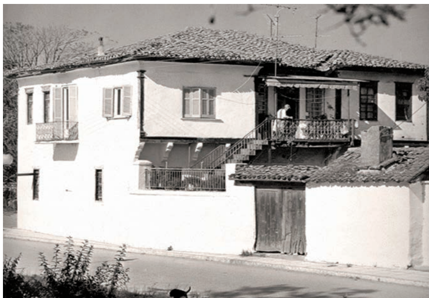
Η παραδοσιακή οικία Βενιώτη, δείγμα της αρχιτεκτονικής του τόπου.

Ο μόνος ίσως που ξεχώρισε ήταν ο αείμνηστος μητροπολίτης Ιωάννης που σε 10 χρόνια κατάφερε με τη συνεργασία των ιερέων να αναστηλώσουν 12 μεταβυζαντινούς ναούς, να κάνει 3 μουσεία, κατασκηνώσεις, προσκυνηματικά κέντρα, επειδή στόχευε στο μέλλον και τον θρησκευτικό τουρισμό της επαρχίας μας και βέβαια την ανάπτυξή της.