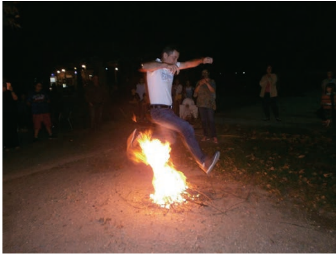
24 Ιουνίου του αγίου Ιωάννου του Προδρόμου.

Την παραμονή της γιορτής του αγίου Ιωάννου, στηνόταν ο κλήδονας, δηλαδή σε κάθε γειτονιά άναβαν μεγάλες φωτιές, στις οποίες έκαιγαν τα στεφάνια της πρωτομαγιάς και όλοι πηδούσαν πάνω από τις φωτιές λέγοντας: «όξου ψύλοι και κοριοί, μέσα υγεία και χαρά»! Σε παλαιότερες εποχές οι νέες κοπέλες έριχναν σε ένα κεραμικό αγγείο κάτι από τα στολίδια τους και ακολουθούσαν τα μαντέματα για το ποια θα παντρευτεί γρηγορότερα και ποιόν θα πάει για άντρα. Όλα αυτά τα δρώμενα προφανώς ήταν αντίθετα με τη θέση της εκκλησίας και ιδίως με την απόφαση της Πενθέκτης οικουμενικής συνόδου (κανόνας ξε΄) η οποία κατεδίκασε τις εκδηλώσεις πυρολατρείας, κλήδονα, μαντεμάτων και άλλων παράλληλων εκδηλώσεων. Όμως οι χριστιανού προκειμένου να περισώσουν το έθιμο το συνέδεσαν με την γιορτή του Προδρόμου και το κάψιμο των στεφανιών του Μαΐου.