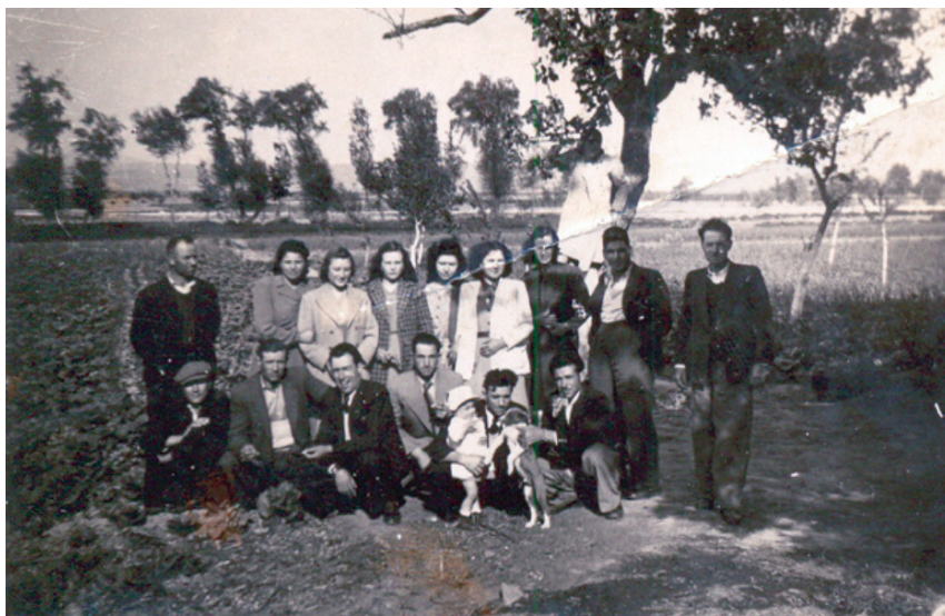
Πασχαλινό γλέντι, 1946.