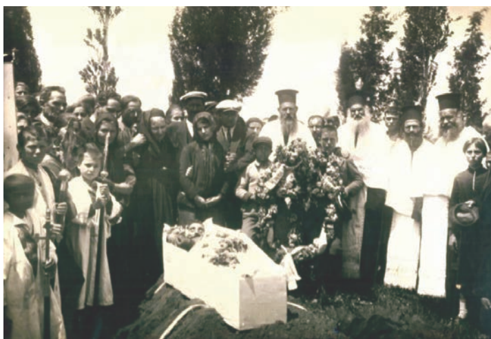
Κηδεία στο Λαγκαδά περί το 1939.

νερό, για τρεις μέρες και τρεις νύχτες για να έρχεται η ψυχή του νεκρού να δροσίζεται. Όταν τελειώνει η νεκρώσιμη ακολουθία οι Μικρασιάτες στην καταγωγή Λαγκαδιανοί είχαν το έθιμο να βγαίνουν φωτογραφία όλοι οι συγγενείς με τον νεκρό αλλά και τον κόσμο που συμμετείχε στην κηδεία.