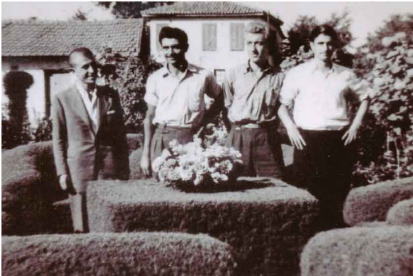
Νεανική συντροφιά στο πάρκο της πόλης.