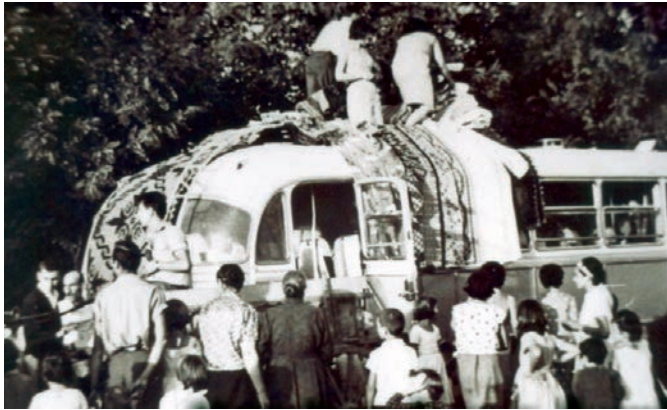
Μεταφορά της προίκας με το... λεωφορείο.

Το βράδυ της Παρασκευής ο γαμπρός στέλνει με 3-4 φίλους στη νύφη το σεντούκι για να βάλει μέσα τα προικιά της. Το σεντούκι το πηγαίνουν με το κάρο, αλλά και με τραγουδία. Στα χαλινάρια του αλόγου κρεμούν ένα άσπρο μαντήλι και για να μη γυρίσει τελείως άδειο το κάρο, ή νύφη βάζει απάνω τις γλάστρες με τα λουλούδια που θα πάρει στο νέο της σπιτικό.