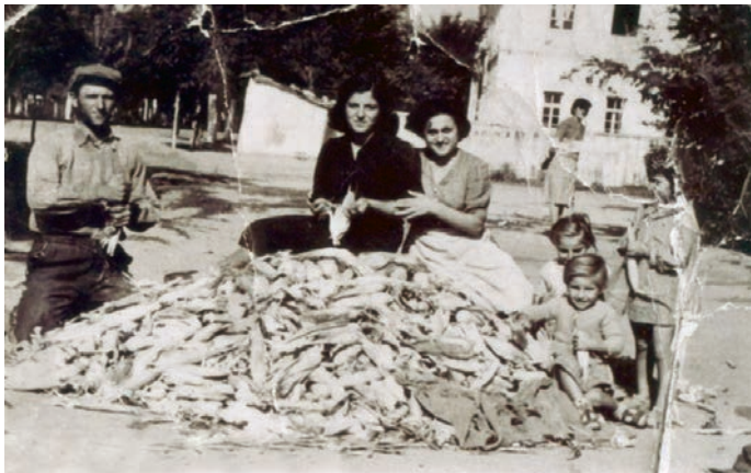
Καθάρισμα καλαμποκιού, Ιούνιος.