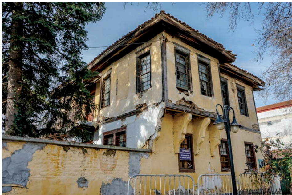
Οικία οικογένειας Ζλατάνου.

Χρειάζεται λοιπόν αναπροσανατολισμός και στοχοθεσία!!! Ποιος θα το κάνει;;;