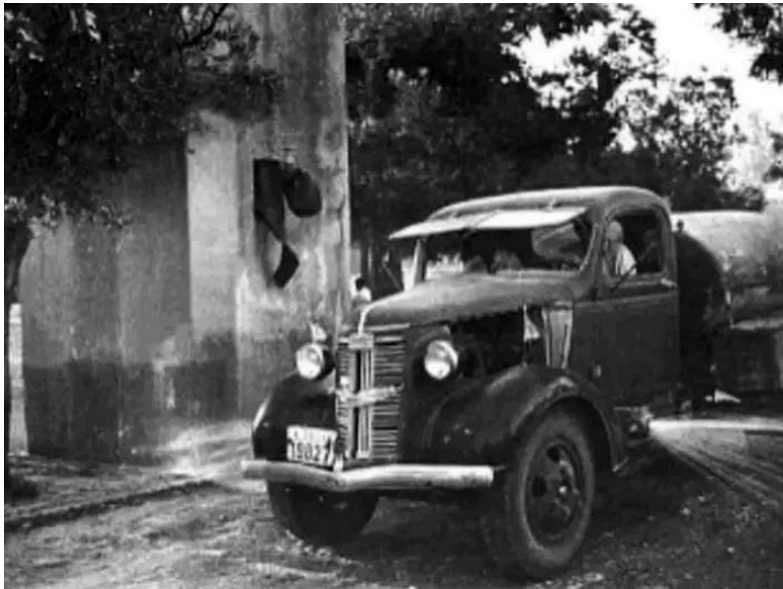
Η καταβρεχτήρα του Δήμου Λαγκαδά.