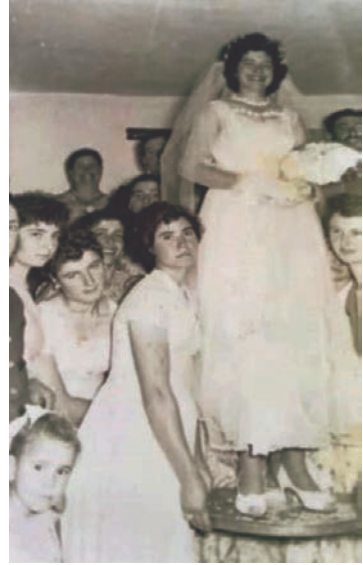
Από το ντύσιμο της νύφης.

Μετά το μεσημεριανό φαγητό ξεκινούσαν για να πάρουν τη νύφη. Όμως πριν ξεκινήσουν, η μάνα του γαμπρού του δίνει ένα μήλο, στο οποίο ο γαμπρός μπήγει δυο-τρία μεταλίκια (δραχμές). Όταν ξεκινήσουν, για την εκκλησία ο πατέρας του, ρίχνει πίσω από τον γαμπρό μια ευχή, και μ' ένα ποτήρι χύνει κρασί λέγοντας: «Να ζήσουν να γηράσουν». Μπροστά πηγαίνουν οι μουσικοί, ακολουθεί το «μπαϊράκι» με τους χορευτές. Αυτοί, όπου βρίσκουν καμιά πλατεία, σταματούν χορεύουν, και φωνάζουν: «όρια παλι-αχού», που θα πει «παλληκάρια του γαμπρού»! Ακολουθεί ένας αδελφός του γαμπρού ή ένας στενός φίλος μ' ένα μπουκάλι ρακί και μ' ένα πιάτο με κουφέτα και μπιλιπίδια. Κατόπιν έρχεται ο κουμπάρος με τον γαμπρό και οι λοιποί καλεσμένοι.