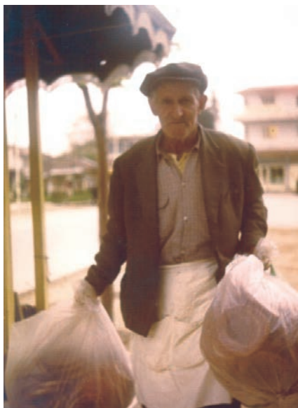
Ο γραφικός κουλουριτζής της πόλης.