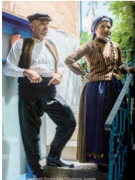
Αναπαράσταση Μουσείου Ιερών Μεταρρύπων, Λαγκαδά