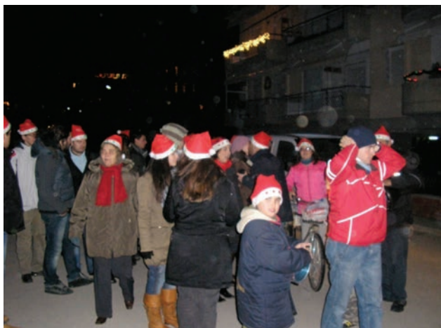
Άγιος Βασίλης έρχεται από την Καισαρία...

Αρχιμηνιά κι αρχιχρονιά ψιλή μου δεντρολιβανιά Κι αρχή, κι αρχή καλός μας χρόνος, εκκλησιά απ' τ' άγιον όρος. Αρχή που βγήκε ο Χριστός, άγιος και πνευματικός στη γη, στη γη να περπατήσει και να μας και να μας καλωσορίσει. Άγιος Βασίλης έρχεται, κι όλους μας καταδέχεται από την Καισαρεία, συ είσαι αρχόντισσα κυρία. Βαστάει εικόνα και χαρτί, ζαχαροκάντιο ζυμωτή χαρτί και καλαμάρι, δεσ και εμέ, δεσ κι εμέ το παλικάρι. Το καλαμάρι έγγραφε, την μοίρα του την έλεγε και το χαρτί ομίλει, άγιε μου καλέ Βασίλη!! Και του χρόνου με υγειά!