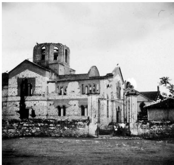
Η αγία Παρασκευή στα 1941.