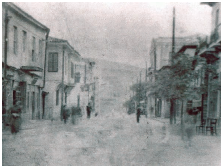
Η οδός Μεγάλου Αλεξάνδρου, 1923.