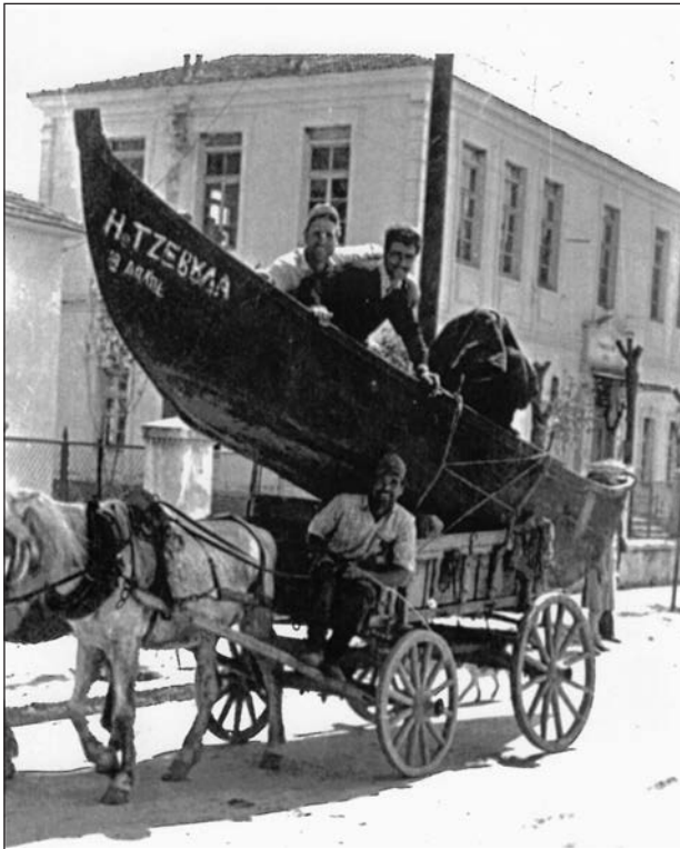
Η μεταφορά της βάρκας στη λίμνη.

Η πρώτη μέρα του Φλεβάρη για τους αγρότες σήμαινε έναρξη δραστηριοτήτων και προγραμματισμών. Ετοιμασία της γης για τη σπορά, τα φυτέματα, κλαδέματα, η άλλη δε μεγάλη συντεχνία του Λαγκαδά, οι ψαράδες, ξεκινούσαν το καλαφάτισμα των καραβιών για τη νέα περίοδο. Στις αυλές των ψαράδων και στην αυλή των Βενιωτάδων, οι οποίοι ήταν μοναδικοί κατασκευαστές καραβιών για τη λίμνη, οι οποίοι είχαν καταγωγή από την Πρέβεζα και έκαναν κι εκεί καράβια για την Βενετιά σε άλλες εποχές, τώρα είχαν καρνάγιο κατασκευής καραβιών στο Λαγκαδά, έβραζαν τις πίσσες για το πισσάρισμα, επιμελούνταν την επισκευή των εργαλείων της βάρκας, ξεχύνονταν στα χωράφια για να βρουν τα κατάλληλα ξύλα για τις επισκευές των καραβιών, οι δε ψαράδες και οι γυναίκες μπάλωναν τα δίχτυα για να αντέξουν ακόμη μία χρονιά. Μοσχοβολούσε όλη η γειτονιά πίσσα και ρακί, γιατί δουλειά χωρίς ρακί, δεν προχωρούσε.