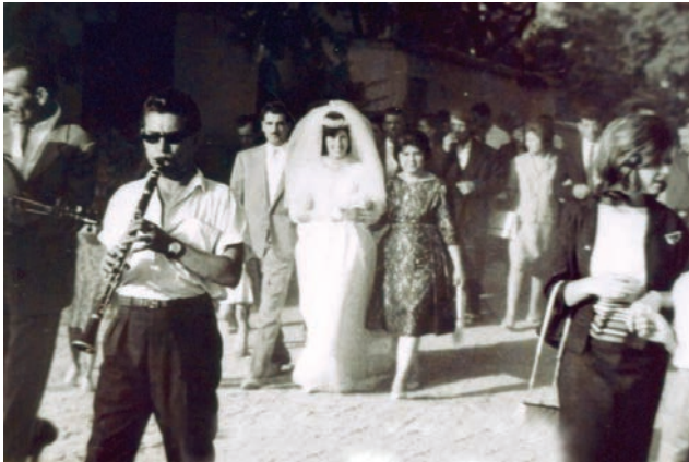
Στον δρόμο προς την εκκλησία.

Μια γριά της οικογένειας θα ρίξει ένα κανάτι νερό ξωπίσω τους στο δρόμο λέγοντας: «σαν το νερό να κυλίσει η ζωή σας».