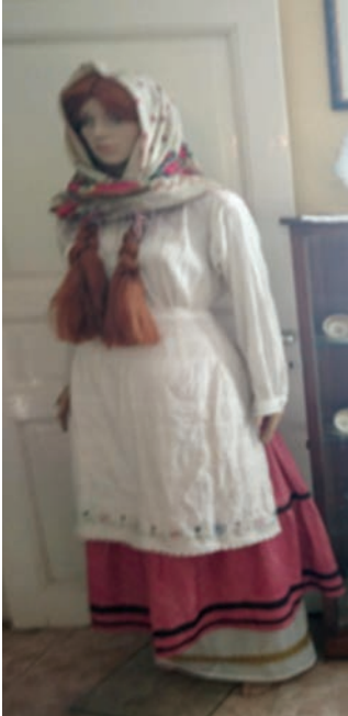
Καλοκαιρινή φορεσιά κοπέλας.