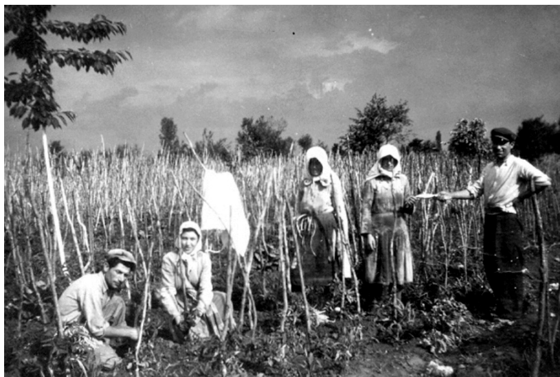
Συνεργείο εργασίας στον μπαξέ του Φυλάκη. 1946.