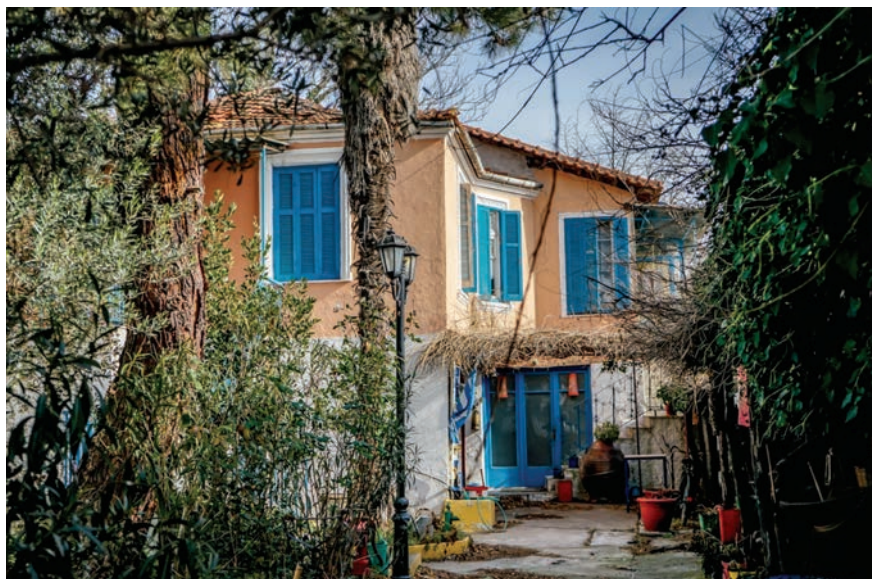
Το Λαογραφικό Μουσείο της Ιεράς Μητροπόλεως Λαγκαδά.

Στην ευρύτερη περιφέρεια του Δήμου Λαγκαδά, ιδιαίτερο ενδιαφέρον παρουσιάζει το αρχαιολογικό μουσείο της αρχαίας Καλίνδοιας με πολύ ενδιαφέροντα ευρήματα από τις ανασκαφές στην περιοχή. Επίσης το ιστορικό μουσείο των Βαλκανικών πολέμων στο Λαχανά, που είναι η ιστορική έδρα του Δήμου, έχει τη δυνατότητα να εξάψει την ιστορική μνήμη των επισκεπτών.