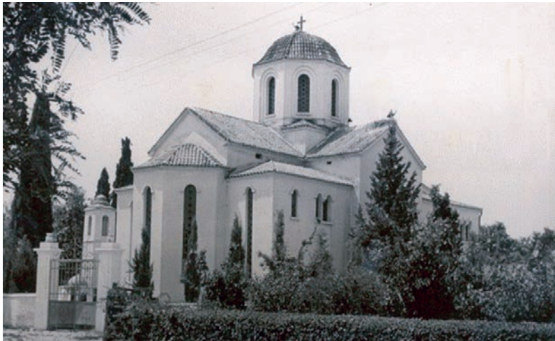
Ο Ναός της Αγίας Παρασκευής (ανατολική πλευρά).