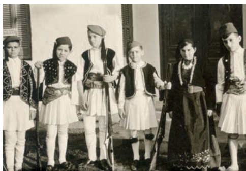
Από θεατρική παράσταση της 25 ης Μαρτίου, 1960.

Άλλες γιορτές του Μαρτίου που έχουν λαογραφικό και εκκλησιαστικό ενδιαφέρον είναι αυτές που πέφτουν μέσα στη Μεγάλη Σαρακοστή. Αυτές είναι: