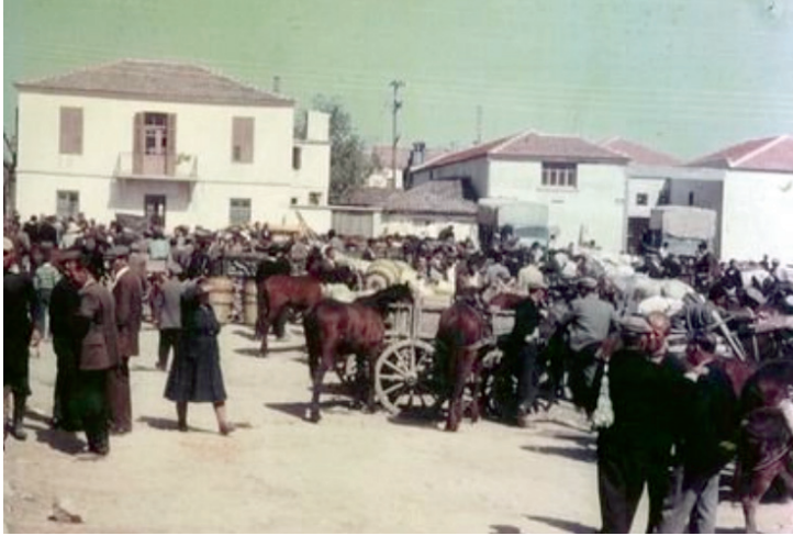
Η μεγάλη λαϊκή αγορά της Τρίτης.

Κάθε Τρίτη γινόταν μεγάλη λαϊκή αγορά το λεγόμενο παζάρι, όπου οι αγρότες είχαν την ευκαιρία να πουλήσουν τα αγαθά τους, αλλά και ο κάθε είδους επαγγελματίας είχε την ευκαιρία να εκθέσει και να πουλήσει τα προϊόντα του. Ήταν δε συγχρόνως και ζωοπάζαρο.