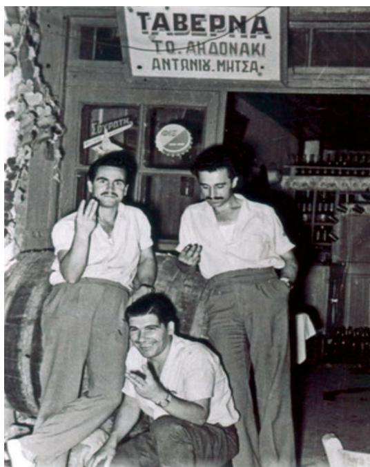
Η ταβέρνα «Το αηδονάκι».