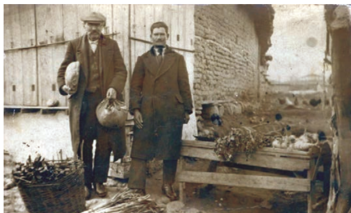
Ο μανάβης στον αυτοσχέδιο πάγκο του, 1926.

Τα διάφορα οπωροκηπευτικά που παρήγαγε ο κάμπος διοχετεύονταν στην ντόπια αγορά από τους μανάβηδες οι οποίοι με τα κάρα διέρχονταν την πόλη για να πουλήσουν το «χρυσάφι» της λαγκαδιανής γης. Με τα κάρα επίσης πήγαιναν και στη Θεσσαλονίκη, ξεκινώντας από το ξημέρωμα για να φτάσουν το πρωί στην λαχανογορά της Θεσσαλονίκης.