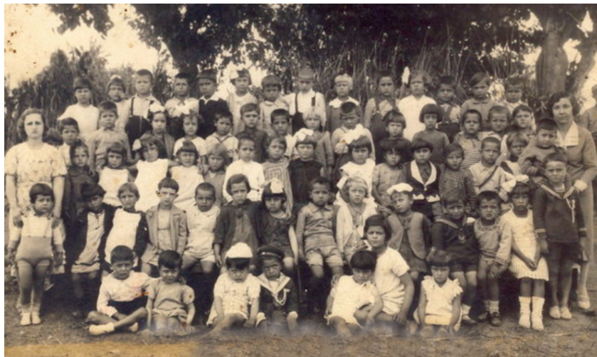
Νηπιαγωγείο Λαγκαδά, 1934.