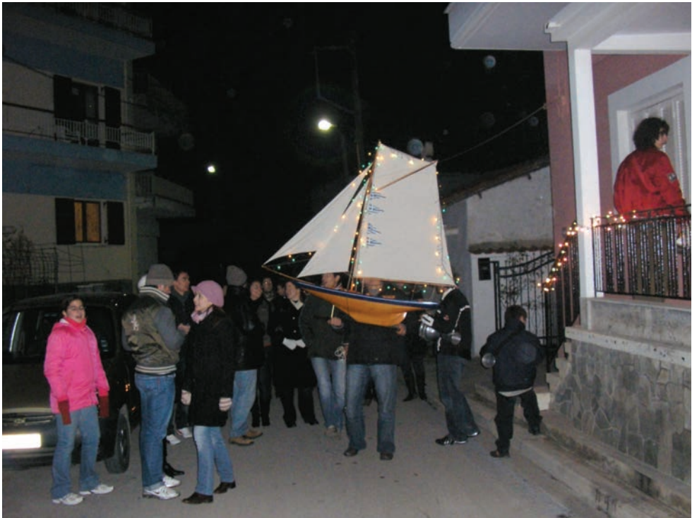
Κάλαντα στην πόλη.

λες εθνικές συνθήκες δεν επέτρεπαν και πολύ τη γιορταστική ατμόσφαιρα αλλά και η φτώχεια ήταν ένας βασικός λόγος για τον χαμηλό τόνο των γιορτών. Αργότερα με την αλλαγή της κατάστασης, βλέποντας και τις άλλες πόλεις, κυρίως τη Θεσσαλονίκη, άρχισαν να στολίζονται και τα πρώτα χριστουγεννιάτικα δέντρα, τα οποία δεν ήταν βέβαια έλατα, αλλά κυρίως πουρνάρια από τα γύρω βουνά που ήταν σε αφθονία. Το στολίδι, όχι τίποτα ιδιαίτερο, μανταρίνια και φιρίκια, ακόμα και καρύδια, τυλιγμένα σε χρυσόχαρτο ή άλλα χρωματιστά χαρτιά έδιναν φως στο δέντρο, και μια μικρή φάντη ζωγραφισμένη από τα παιδιά στο σχολείο, στόλιζε το σπιτικό. Αργότερα άρχισαν να εκδίδονται κάποια δυτικοφερμένα αγγελούδια, αστέρια, και μάγοι, τα οποία κολλούσαν πάνω σε χαρτόνι και συμπλήρωναν το σκηνικό της γιορτής.