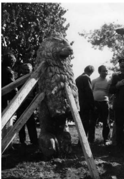
Το λεοντάρι της αρχαίας Μυγδονίας.

που μπορεί το 1940 να είχε αναψυκτήριο, και ταβέρνα, τώρα παραμένει έρημο. Ενώ τα 2 Μπίλλεια πολιτιστικά κέντρα στο Λαγκαδά και στο Σωχό, περιμένουν επί δεκαετίες την ολοκλήρωσή τους!