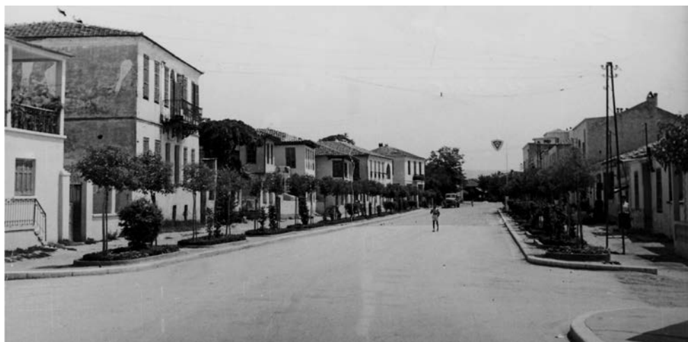
Η κεντρική λεωφόρος, η οδός Μεγάλου Αλεξάνδρου.

ακόμα και οι πολιτικές τους πεποιθήσεις πολλές φορές ονοματοδοτούσαν και τις γειτονιές τους. Έτσι στην περιοχή των Λουτρών που χτίστηκε ο συνοικισμός των προσφύγων από τη Ρωσία, ονομάστηκε σκωπτικά «Τα κάκκινα σπιτάκια», ο συνοικισμός Παπακυριαζή, εξαιτίας των πολιτικών φρονημάτων κάποιων κατοίκων ονομάστηκε «Στάλιγκραντ», ο οικισμός των ανθρώπων που είχαν λαχανόκηπους ονομάστηκε «Μαναβιά» η δε αρχαιότερη συνοικία της πόλης που ξεκινούσε από το Α΄ Δημοτικό και πέρα ονομάστηκε «Μικρά Ελβετία», γιατί είχε σχεδόν τα περισσότερα καταστήματα, σχολείο, και Μητρόπολη.