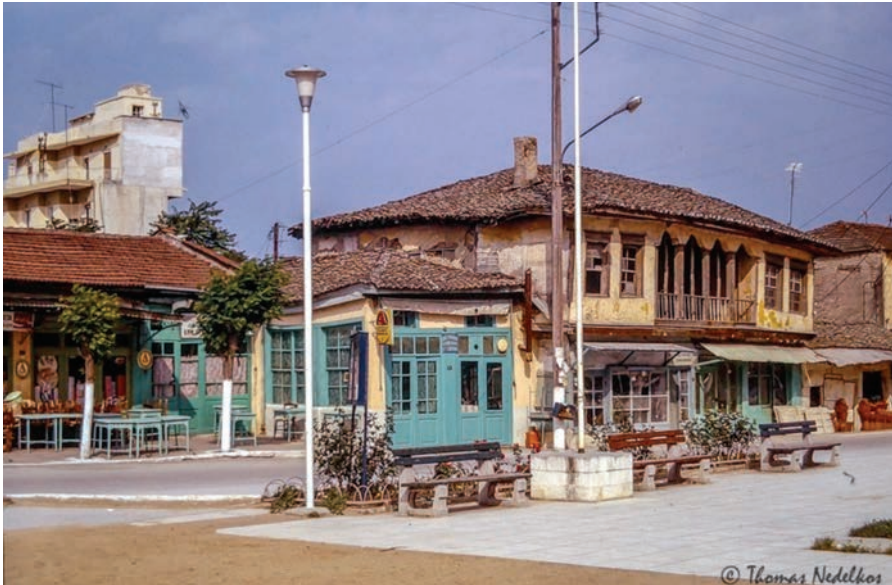
Η κεντρική πλατεία Λαγκαδά, 1974.

αιτήματος της ψυχής του ανθρώπου, να λυτρωθεί από την καθημερινή του υποκρισία με μια έκφραση ανωνύμου διονυσιακής νέας υποκρισίας. Είναι τραγική μορφή ο καρνάβαλος, ζητά να λυτρωθεί από την υποκρισία, υποκρινόμενος. Ζητά να καταλύσει όλες τις προσωπίδες που φορά καθημερινά, με μια νέα την πιο απίθανη. Το βαθύτατο αίτημά του είναι να μεταμορφωθεί, αλλά δεν το καταφέρνει με την προβιά ή την προσωπίδα και την ιδιόμορφη συμπεριφορά» (Μελίτων Χαλκηδόνας).