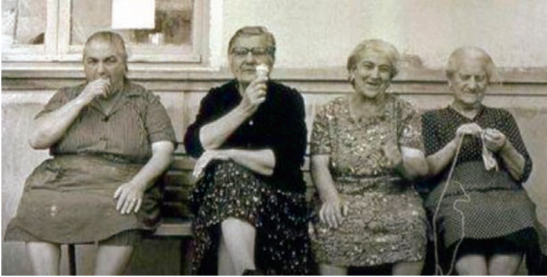
Μουχαμπέτι και παγωτάκι καλοκαιρινό.