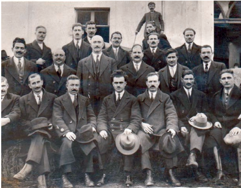
Οι Επαγγελματίες του Λαγκαδά.