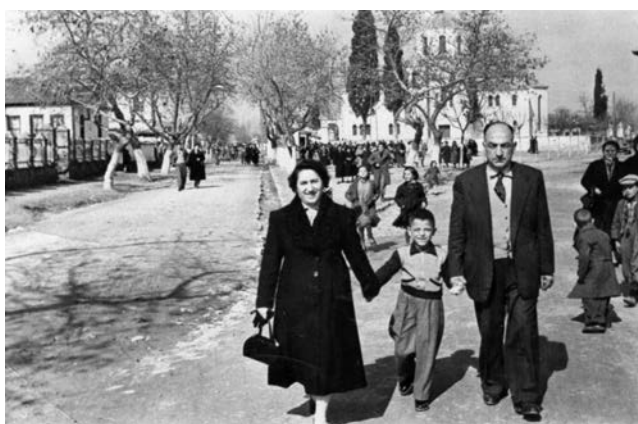
Μετά τη Λειτουργία...

πορεύονται προς την εκκλησία. Μετά την πανηγυρική χριστουγεννιάτικη λειτουργία, επιστρέφανε στο σπίτι για το πιο χορταστικό πρωϊνό, με κουλούρια σαραγλιά, μπακλαβάδες, χοιρινή τηγανιά, τσιγαρίδες, γλυκό κρασί κι ότι άλλο μπορούσες να ονειρευτείς. Το μεσημεριανό τραπέζι ήταν σχεδόν συνέχεια του πρωϊνού, γιατί κατά το συνήθειο, μετά την εκκλησία περνούσαν συγγενείς και φίλοι για τα χρόνια πολλά, οπότε η παρέα μεγάλωνε. Το γεύμα περιελάμβανε συνήθως γαλοπούλα, κόκορα, ή «αρνίθα γιομοστή» (κότα γεμιστή με ρύζι), άλλοι που εξέθρεφαν κανένα γουρουνάκι, το απολάμβαναν φυσικά ανήμερα της γιορτής, ενώ οι πιο φτωχοί αρκούσαν σε καμιά ψαρόκοτα που μάζευαν από τη λίμνη και ήταν μισοπαγωμένες από το κρύο. Τα παιδιά περνούσαν από τις γιαγιάδες και τους παππούδες για τα χρόνια πολλά και το μπαξίσι τα δε σπίτια που είχαν Χρήστους και Μανώληδες είχαν ολημερίς το τραπέζι στρωμένο.