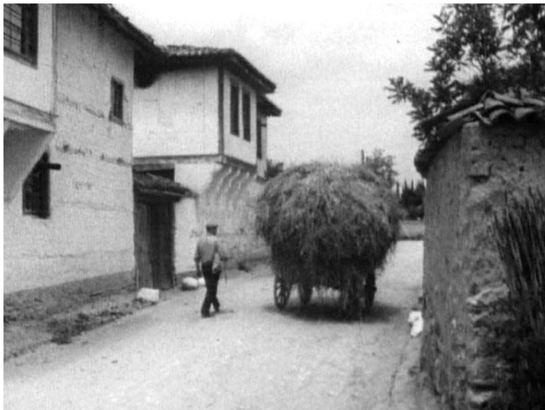
Επιστροφή στο σπίτι από το χωράφι.