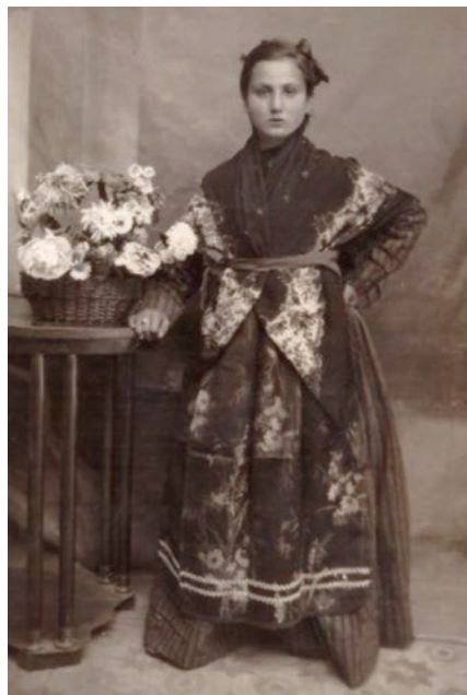
Γυναικεία φορεσιά περί του 1900.