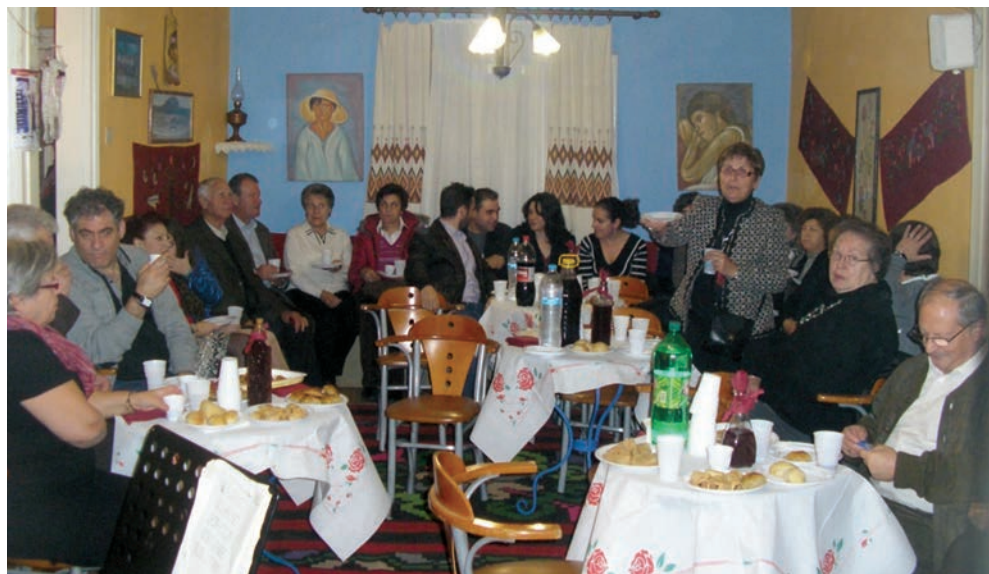
Τα σπίτια πάντα γεμάτα στη χαρά... Το σπίτι του Πολιτιστικού Οργανισμού Μυγδονία.

Έτσι περνούσε η μέρα στη χαρά της γιορτής και της ξεγνοιασιάς, συνδυάζοντας τα πνευματικά με τα έθιμα. Φρόντιζαν να περάσει χαρούμενη και ειρηνική για να είναι όλο το νέο έτος ειρηνικό και χαρούμενο.