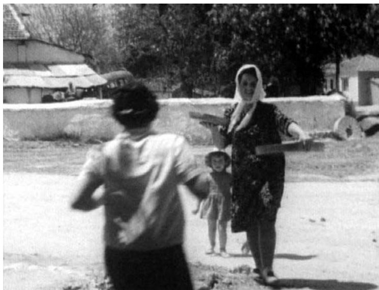
Προετοιμασίες για τα τσουρέκια.

Σε κάθε γειτονιά άναβαν 3-4 φούρνοι και όλες οι γειτόνισσες με τη σειρά τους φούρνιζαν και έκαναν τα σχετικά σχόλια η μια για τα τσουρέκια της άλλης. Μερικές το είχαν σε κακό, να δουν κάποιες τα τσουρέκια τους, γιατί πίστευαν ότι τα μάτιαζαν και δε θα φούσκωναν στο ψήσιμο. Παντού λοιπόν μυρωδιές και αρώματα, ανακατεμένα με θυμιάματα, πασχαλιές και ζουμπούλια που πήγαιναν στην Εκκλησία για το σταυρό και τον Επιτάφιο. Οι ελεύθερες που πήγαιναν στεφάνι στο σταυρό, πίστευαν ότι του χρόνου θα είναι παντρεμένες, και τότε έβγαινε ο παπάς κρατώντας στον ώμο του τον σταυρό και με τον πένθιμο χτύπο της καμπάνας εισόδευε τον σταυρό ως το κέντρο του ναού. «Σήμερα κρεμάται επί ξύλου ὁ ἐν ὕδασι τὴν γῆν κρεμάσας...». Κι ύστερα άμα τέλειωνε η ακολουθία και αραίωνε ο κόσμος όσοι ήθελαν και ήταν πολλοί, έμεναν στο ναό για να ξενοχτίσουν το νεκρό Χριστό.