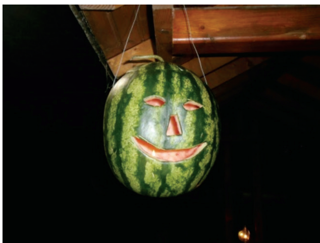
Το καρπουζοφάναρο που έφεγγε τις νύχτες τις αυλές.

Η γιορτή των αγίων Αποστόλων ήταν μια μεγάλη γιορτή για το λαό, γιατί είχε την ευκαιρία να τιμήσει λειτουργικά τους δώδεκα άνδρες που άλλαξαν την πορεία της ανθρωπότητας. Η γιορτή τους συνοδεύονταν από νηστεία η οποία καθορίζονταν από τον κύκλο των κινητών εορτών και το Πάσχα. Η γιορτή που είχε να κάνει και με το θέρος, καθώς έδινε μια ακόμα ευκαιρία στον κόσμο να χαρεί και να πανηγυρίσει, γι αυτό και μαζεύονταν στα αλώνια, στα όρια της πόλης του Λαγκαδά, όπου έστηναν το χορό, πρώτα οι κοπέλες και μετά τα παλικάρια, τα οποία συνήθως έφεραν και μουσικούς από την Τζουμαγιά και γλένταγαν όλη τη μέρα. Κάποιες φορές έστηναν στα αλώνια παλαίστρες και πάλευαν τα παλικάρια για να δείξουν την μυϊκή δύναμή τους. Το έθιμο της πάλης διατηρείται ακόμα στο Σωχό ως τις μέρες μας.