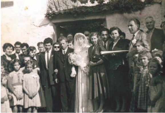
Περιμένοντας τον γαμπρό.