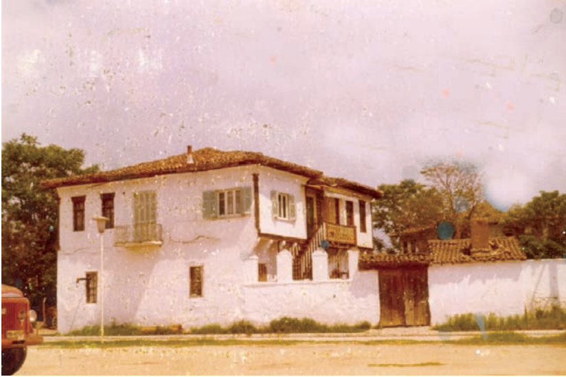
Αρχοντικό της οικογένειας Βενιώτη.