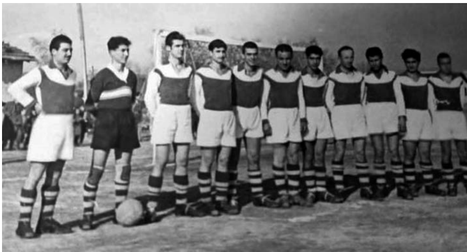
Η Αθλητική Ποδοσφαιρική Ένωση Λαγκαδά (ΑΠΕΛ 1950).