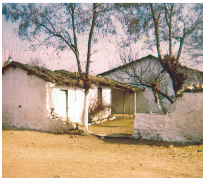
Αγροτική κατοικία οικογένειας Κακαβράκα.