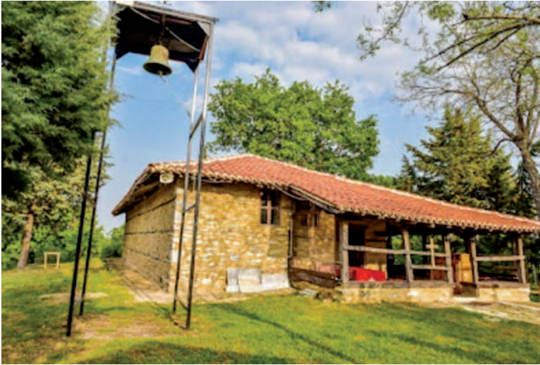
Ο Ναός αγίου Αθανασίου Χωρούδας.

Οι εραστές της καλής κουζίνας, μπορούν επίσης να απολαύσουν τα ντόπια κρέατα και την ντόπια κουζίνα σε πολλά μέρη της ευρύτερης περιοχής. Ταβέρνες θα βρείτε στο Λαγκαδά, στη Χρυσαιγή, στις Πέντε Βρύσσες, στην Όσσα, στο Σοχό, στα Πετροκέρασα, στον Ασκό, και πολύ καλές γεύσεις σε όλα τα κατεσπαρμένα στα χωριά ταβερνάκια, για το ψάρι σας όμως καλό θα είναι να κατευθυνθείτε προς τον Άγιο Βασίλειο, το παλιότερο ψαροχώρι της περιοχής.