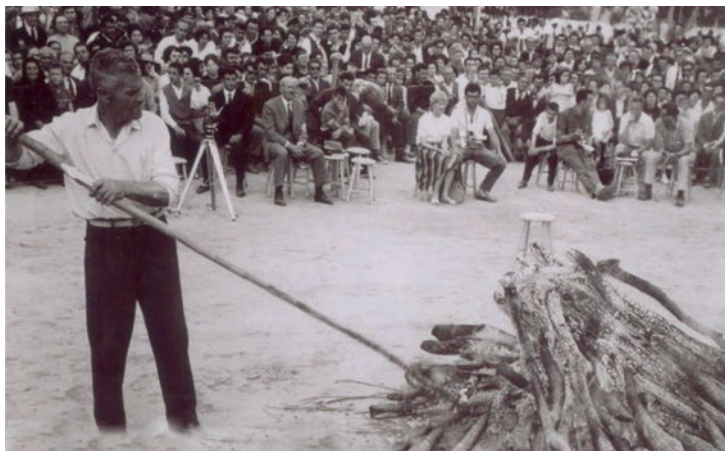
Προετοιμασία για την πυροβασία.

Πρόκειται για κατάλοιπο ειδωλολατρικών - οργιαστικών εθίμων, αναμειγμένων με χριστιανικά λατρευτικά έθιμα, που τελείται σε περιοχές της βορείου Ελλάδος, από ανθρώπους Θρακικής καταγωγής. Το έθιμο στον Ελλαδικό χώρο ήλθε μετά το 1922, από πρόσφυγες της Θράκης, κυρίως από το χωριό Κωστή αλλά και από άλλα χωριά της περιοχής της Βιζύης. Στις περιοχές αυτές το έθιμο ετελείτο από πολλά χρόνια, ως μια τοπική παράδοση, ξεκινούσε μάλιστα από τις 2 Μαΐου (εορτή του Αγ. Αθανασίου) και κορυφώνονταν στις 21 Μαΐου εορτή των αγίων Κωνσταντίνου και Ελένης. Σε άλλα χωριά το έθιμο τελούνταν και κατά την γιορτή του Αγίου Παντελεήμονος στις 27 Ιουλίου. Σήμερα περιορίζονται μόνο στο τριήμερο 21-23 Μαΐου και στις 27 Ιουλίου σε στενό οικογενειακό κύκλο.