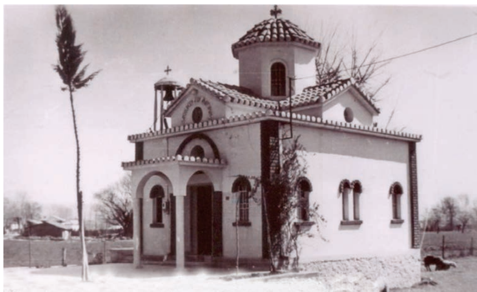
Το παρεκκλήσι των Αγίων Αναργύρων, 1950.

νεια και προσέτρεχαν στη χάρη τους όσοι κατά καιρούς ταλαιπωρούνταν από κάποιες ασθένειες, γι αυτό και υπήρχε παράδοση να αφιερώνουν στην εικόνα τους αφιερώματα, που είχαν να κάνουν με την ασθένειά τους, όπως ομοιώματα ματιών, ποδιών, χεριών, που θεωρούσαν ότι οι άγιοι βοήθησαν στην θεραπεία τους. Τους θεωρούσαν δε προστάτες τους και έψαλλαν ενώπιον της εικόνας τους το απολυτίκιό τους: «Άγιοι Ανάργυροι καί θαυματουργοί, έπισκέψασθε τάς άσθενείας, δωρεάν έλάβετε δωρεάν δότε ήμιν».