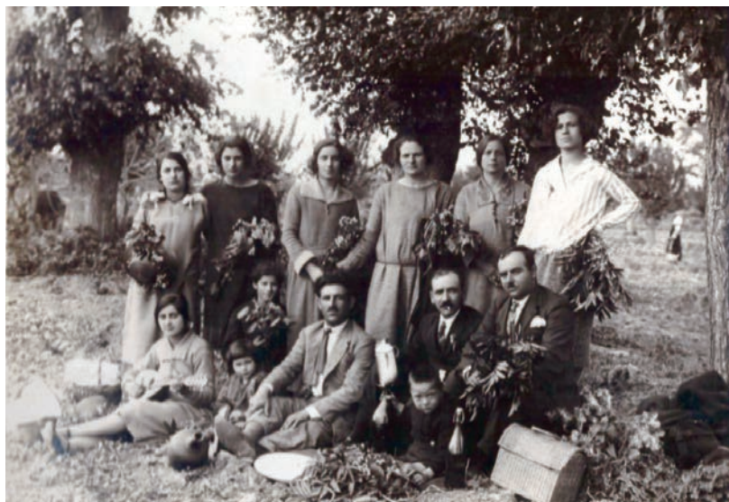
Πρωτομαγιά στα Λουτρά. 1938.