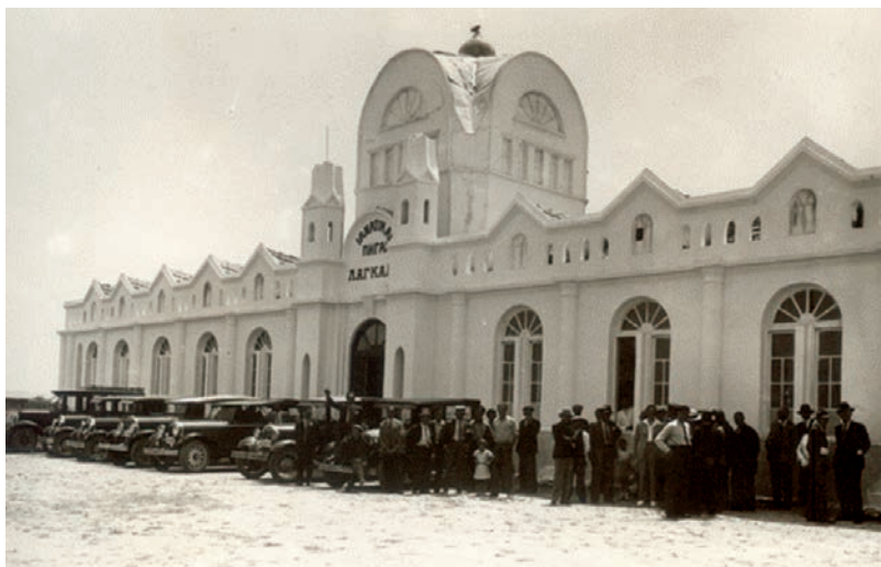
Λουτρά Λαγκαδά 1932.