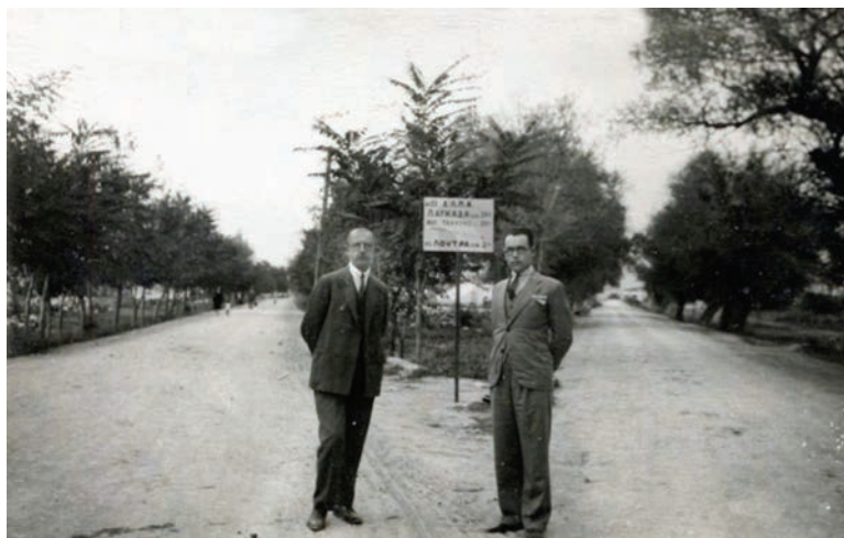
Η είσοδος της πόλεως στα 1920.

Ο Μακεδονικός αγώνας γράφει σελίδες δόξης με αίμα παλικαριών, ανδρών και γυναικών, που πλουτίζουν την ιστορική κληρονομιά της περιοχής και στις 27 Οκτωβρίου του 1912, ο Λαγκαδάς και η περιοχή του γνωρίζουν την ελευθερία από τον βαρύ τουρκικό ζυγό. Η Γερμανική κατοχή το ίδιο σκληρή κι απάνθρωπη, θα προσθέσει στην ιστορία της πόλης εκατόμβες θυμάτων της ναζιστικής θηριωδίας, και στις 27 Οκτωβρίου του 1944 κατά αγαθή συγκυρία απελευθερώνεται η πόλη του Λαγκαδά από τα ναζιστικά στρατεύματα κατοχής.