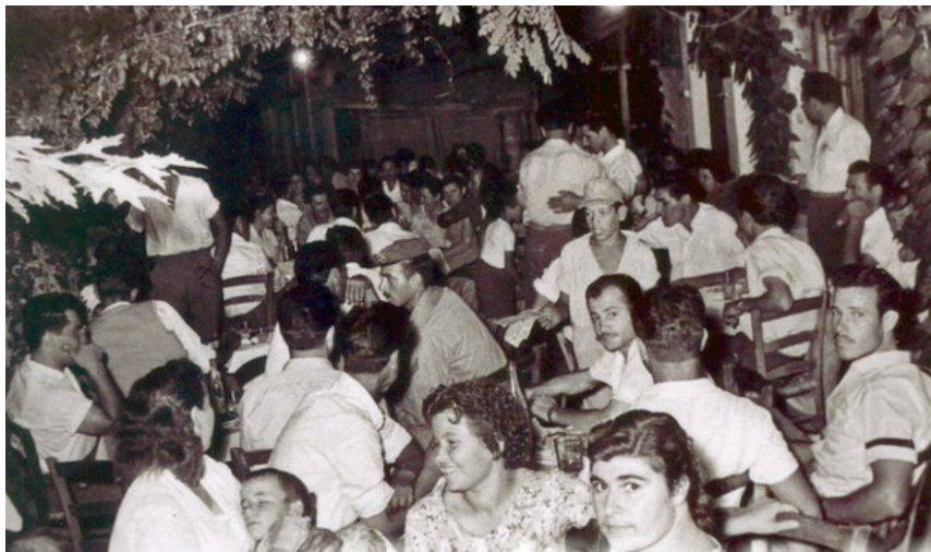
Καλοκαιρινή βραδιά στου «Ρουμάνου».