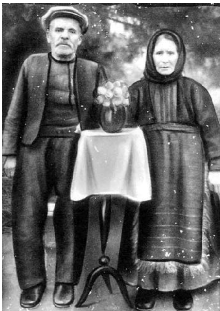
Ενδυμασία γερόντων περί το 1900.

Η ανδρική φορεσιά ήταν θα λέγαμε η συνήθης σε όλη την επαρχία, δηλαδή αποτελούνταν από το μπενεβρέκι, που ήταν από χονδρό γκριζο μάλλινο ύφασμα, υφασμένο στον αργαλειό και χτυπημένο στη νεροτριβιά. Το καλοκαιρινό μπενεβρέκι ήταν από βαμβακερό ύφασμα. Οι πλούσιοι το έκαναν από τσόχα. Στη μέση έσφιγγε με ζωνάρι και αποτελούνταν από τρία φύλλα υφάσματος. Εσωτερικά φορούσαν το βρακοζώνι, που ήταν όμως από λευκό κάμποτο ύφασμα, και δένονταν επίσης με κορδόνι.