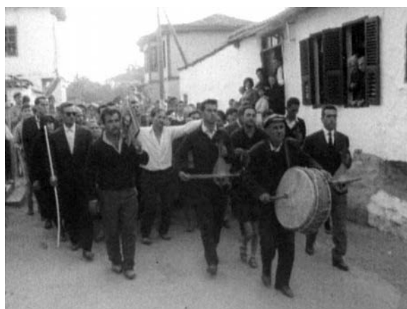
Η πομπή προς την πυροβασία.

Ο Μάιος συνδέονταν μετά το 1942-3 με τα Αναστενάρια και τη γιορτή των αγίων Κωνσταντίνου και Ελένης. Βέβαια πρέπει να πούμε ότι το έθιμο των αναστεναρίων δεν είχε να κάνει με την ντόπια ιστορία και τη λαογραφία της πόλης του Λαγκαδά, δεδομένου ότι πρόκειται για αρχαιοελληνικό-Διονυσιακό έθιμο, Θρακικής προέλευσης, που μεταφέρθηκε στο Λαγκαδά από τους Θρακιώτες πρόσφυγες και καθιερώθηκε περί το 1943 παρά την πρώτη αντίδραση των Γερμανών κατακτητών.