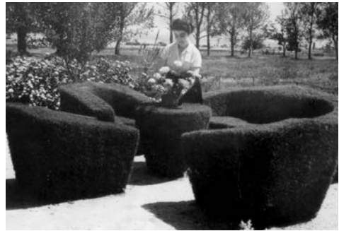
Το πάρκο των Λουτρών.