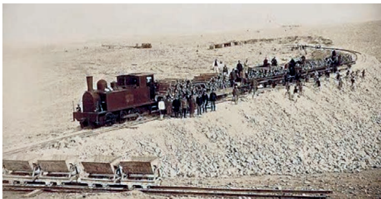
Το οναμαστό τραινάκι της γραμμής Λαγκαδά-Ασπροβάλτας.