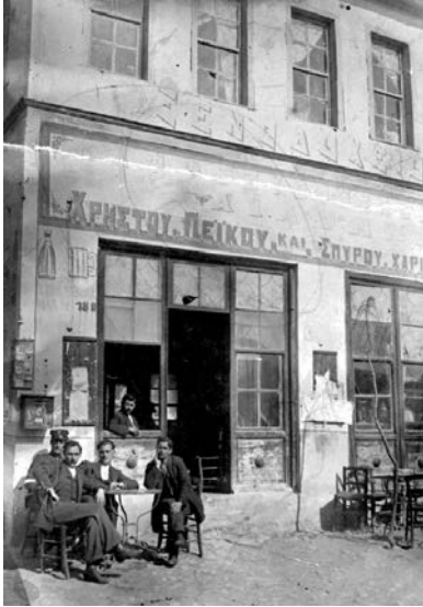
Ξενοδοχείο - Ζυθεςσιατόριο (1911).