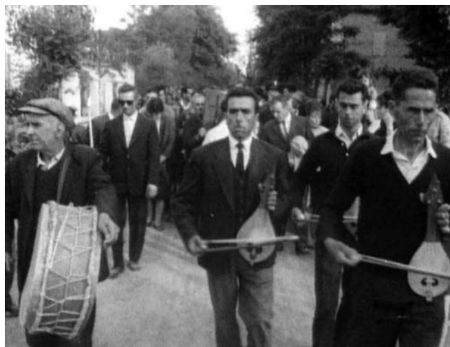
Πηγαίνοντας προς τον χώρο της πυροβολίας.

Το φαινόμενο των αναστεναρίων απασχόλησε τον τελευταίο αιώνα την επιστήμη αλλά και την εκκλησία, δεδομένου ότι πολλοί ήταν αυτοί που πίστεψαν στο φαινόμενο της ακαΐας, ως ένα θαύμα που επιτελείται σε καθορισμένο τόπο και χρόνο. Πρέπει όμως να τονιστεί ότι τα υπερφυσικά φαινόμενα, ή απλά η αναστολή των κανόνων της φύσης, είναι ζητήματα που ανήκουν στη σφαίρα του Θεού ή του σατανά, ή στη ανοχή του Θεού. Αν κάτι πρέπει να εκλαμβάνεται ως χάρισμα του Θεού, θα πρέπει να υπάρχουν και οι στοιχειώδεις προϋποθέσεις της πίστης ή της μετοχής στη λατρευτική ζωή της εκκλησίας. Η άνευ «επικοδομής» δημόσια έκστασις κατακρίνεται από τον Απ. Παύλο διότι ο Θεός δεν είναι «ἀκαταστασίας ἀλλά ειρήνης» (Α΄ Κορ. ιδ΄ 26-33). Η τήρηση εξωτερικών θρησκευτικών τύπων, δεν σημαίνει κατ' ανάγκη και θρησκευτικότητα, ή ορθόδοξη πνευματικότητα. Αυτό που κυρίως ενοχλεί την εκκλησία στην περίπτωση των αναστεναρίων, είναι η κακή χρήση των εικόνων και η διαπόμπευσή τους, υπό τους ήχους οργάνων και οργιαστικού χορού.