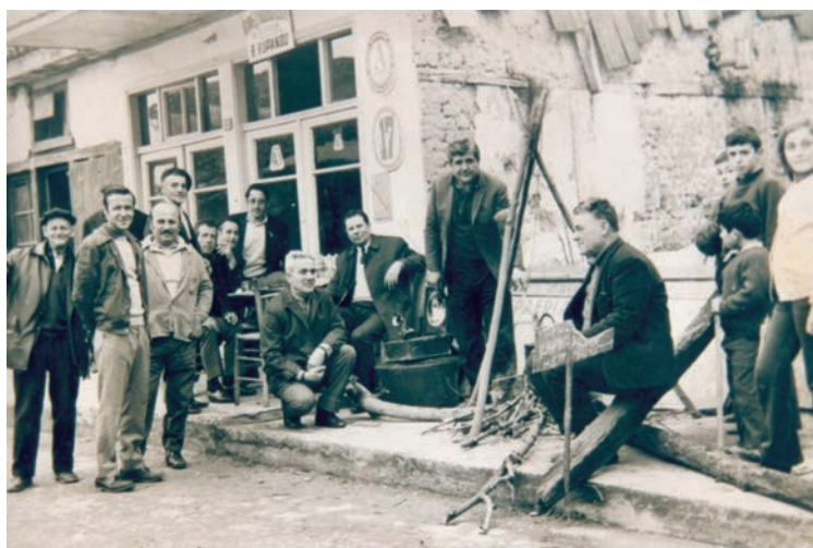
Η παραδοσιακή φασολάδα.

Άλλοι πάλι προσπαθώντας να ισορροπήσουν ανάμεσα στις δύο παραδόσεις άναβαν φωτιές έξω από τα μαγαζιά τους και έβραζαν νερόβραστη φασολάδα και κερνούσαν ελιές, χαλβά και τουρσιά, που τα συνόδευαν με παραδοσιακή μουσική και σκοπούς του τόπου.