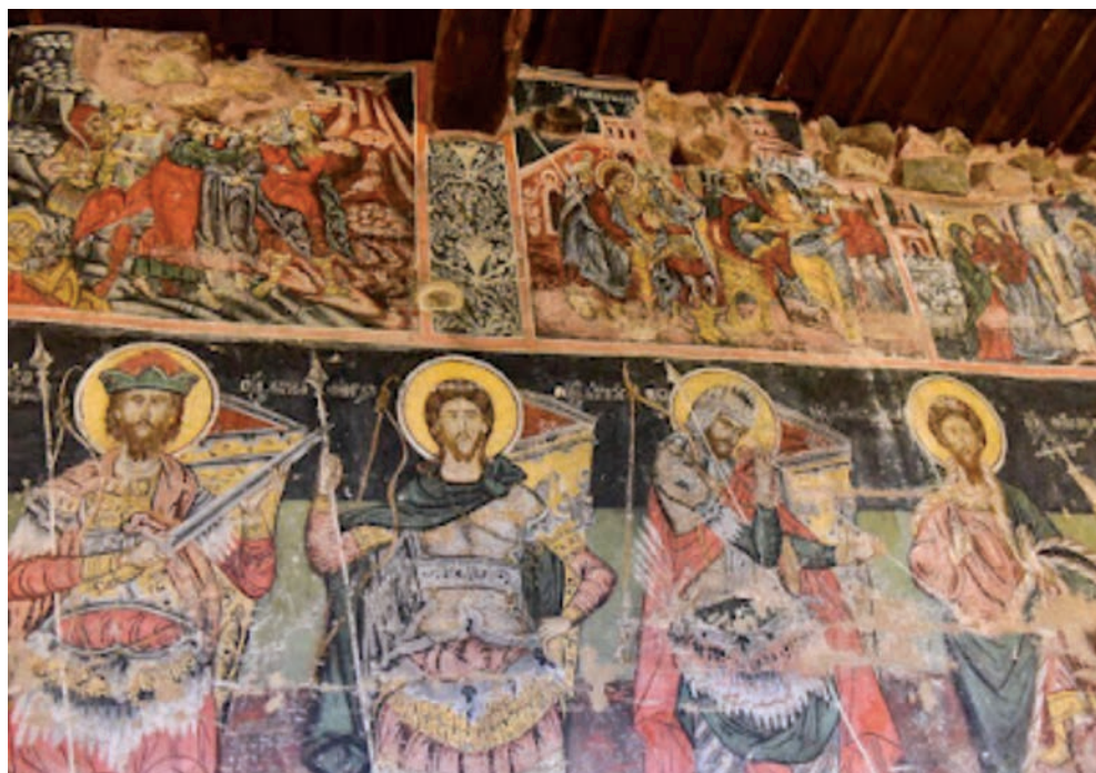
Τοιχογραφικός διάκοσμος του αγίου Αθανασίου Χωρούδας.

Αποκριάς. Η πανήγυρις της Αγίας Παρασκευής (26 Ιουλίου) και της Παναγίας τον δεκαπενταύγουστο, πάντα συνοδεύονται από εκδηλώσεις θρησκευτικού και πολιτιστικού ενδιαφέροντος. Επίσης η γιορτή του αγίου Νέστορος, συμπολιούχου του Λαγκαδά, τιμάται ιδιαίτερα με θρησκευτικές και πολιτιστικές εκδηλώσεις, γιατί συνδέεται με τα ελευθέρια του Λαγκαδά. Αλλά και κάθε χωριό με τους πολιτιστικούς φορείς, πρωτοστατεί στην παρουσίαση των ντόπιων εθίμων και δρωμένων, τραγουδιών, χορών και απανθισμάτων της ντόπιας λαλιάς. Όλη η επαρχία ένα απέραντο πανηγύρι, με τα ΜΥΓΔΟΝΙΑ να αποτελούν την κεντρική εκδήλωση στην πρωτεύουσα του Δήμου και τα Δημοτικά διαμερίσματα.