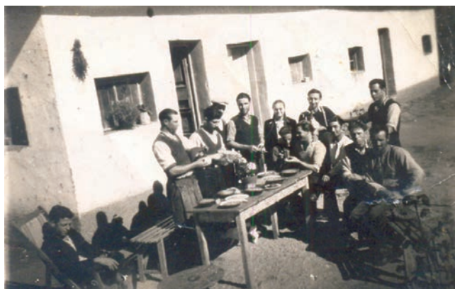
Οι ετοιμασίες στο σπίτι του γαμπρού.