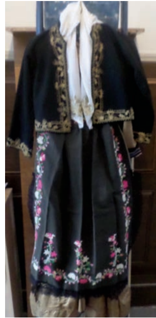
Λαγκαδιανή φορεσιά καθημερινή.

Τη φορεσιά συμπλήρωνε η ποδιά που ήταν σε μαύρο ή καφέ ύφασμα και είχε ωραία κεντήματα και ήταν λουλουδιασμένη. Υπήρχαν και πιο απλές ποδιές υφαντές στον αργαλειό με απλή ραβδωτή διακόσμηση. Και οι γυναίκες φορούσαν το κουπαράνι, δηλαδή ένα είδος γιλέκου που ανάλογα με την οικονομική επιφάνεια ήταν υφαντό, ή από σατέν ή μεταξωτό. Ήταν ντουμπλαρισμένο με γούνα εσωτερικά και στο γιακά. Τα χειμωνιάτικα ήταν τσόχινα και τα καλοκαιρινά με ελαφρύτερο ύφασμα και έφτανε ως τη μέση. Αντίθετα οι τζιουμπές ως χειμωνιάτικο ένδυμα έφτανε ως τα γόνατα ενώ η σκουρτέλα φοριόταν στις γιορτές και ήταν το επίσημο ένδυμα των πλουσίων κυριών, καθώς φοδράρονταν με κόκκινη φόδρα και τόνιζε περισσότερο ως ρούχο. Και οι γυναίκες φορούσαν ζωνάρι που ήταν καμωμένο από μαύρο σατέν ύφασμα. Τα σκουφούνια των γυναικών ήταν άσπρα και μάλλινα, στη κεφαλή φορούσαν κόκκινο φεσάκι, το οποίο δένονταν με ένα τσεμπέρι-μαντήλα. Από πάνω φορούσα το σιαμί, ένα είδος μαντήλας που σκέπαζε το κεφάλι και άφηνε πίσω στους ώμους να κρέμονται οι πλεξούδες των μαλλιών.