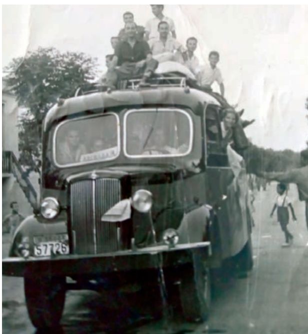
Το κουβάλημα της προίκας 1950.