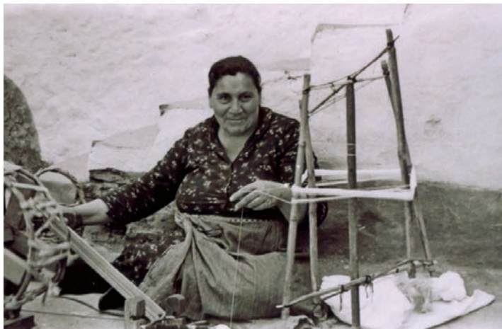
Η κ. Χαρίτου στο ροδάνι.