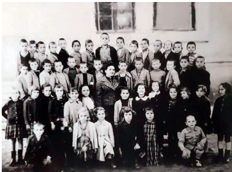
Μια τάξη του Α΄ Δημοτικού Σχολείου Λαγκαδά 1960.