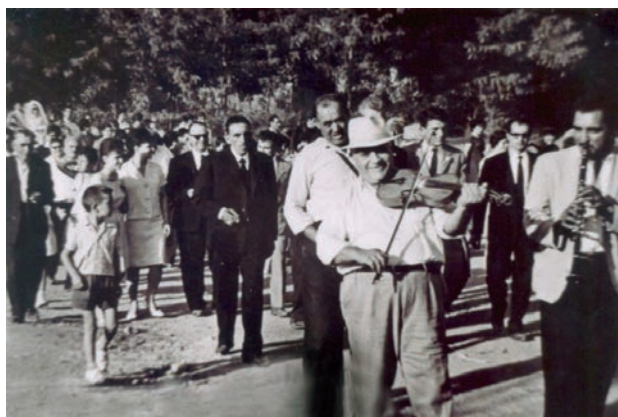
Γαμήλια πομπή προς την εκκλησία.

δες. Τα όργανα δεν έπαιζαν τώρα, γιατί έψελναν οι ψαλτάδες. Κατά τη διαδρομή για το σπίτι οι ένοικοι των σπιτιών που περνούσαν τους έριχναν ρύζι, κουφέτα και λουλούδια.