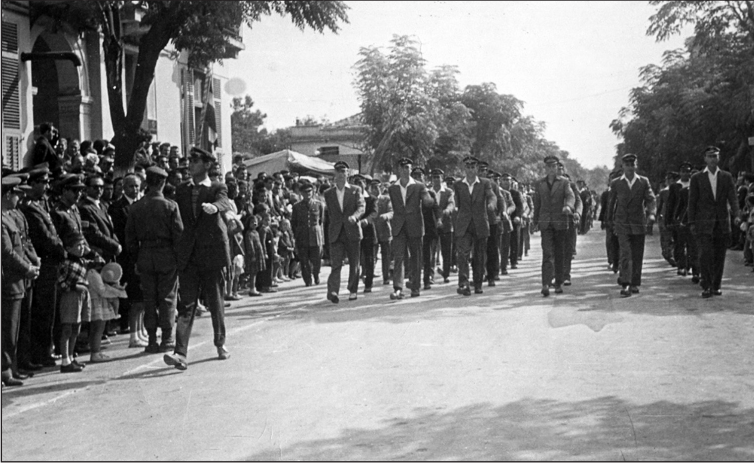
Παρέλαση του Γυμνασίου Λαγκαδά.

με κρασί για να πορεύονται στη ζωή τους. Όμως ο Μάρτης ήταν κοντός και γέρος και παρακάλεσε για να μη παιδεύεται να πίνει από την κάτω τη χαμηλή κάνουλα το κρασί που του αναλογούσε. Και βέβαια σα γέρος που ήταν ξεκίνησε πρώτος το πιωτό. Όταν κάποτε αποφάσισαν και τα αδέρφια του να πιούνε, είδαν πως το βαρέλι ήταν άδειο. Μάταια έκαναν ανακρίσεις. Ο Μάρτης έλεγε πως «εγώ έπινα από τη δική μου κάνουλα, οι δικές σας είναι απείραχτες» και κάθε μέρα είχαν γκρίνια στο σπίτι. Όταν τα αδέρφια του θύμιζαν το γεγονός και ότι θα συνεχίσουν τις ανακρίσεις, αυτός αντάριαζε και άρχιζε ο καιρός να γίνεται νεφελώδης μετά βροντών και καταιγίδων. Όταν τον άφηναν στην ησυχία του, όλα μέλι-γάλα, καλά και αίθρια. Για τότε άλλαξε η διάθεσή του, χαμπάρι δεν τον έπαιρνες, γι αυτό τον λέγαν και πεντάγνωμο, γιατί μπορούσε σε μια μέρα να αλλάξει πέντε γνώμες. Οι τελευταίες