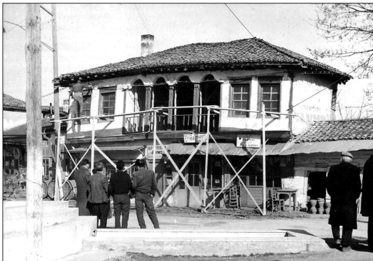
Κτήριο στην πλατεία.

κανείς παντού αυτή την οδυνηρή όπως είπα κατάσταση. Στις 2-3-1912 ο τότε αρχιερατικός επίτροπος Λαγκαδά, ο θρυλικός μακεδονομάχος παπα-Ιωακείμ Ανανιάδης, διαμαρτύρεται στον Βαλή της περιοχής και στο Πατριαρχείο, γιατί κάποιοι με βάρβαρο τρόπο παρενέβησαν στις εκλογές για την αλλοίωση των εκλογικών αποτελεσμάτων, τόσο στα ελληνικά όσο και στα βουλγαρικά και τουρκικά εκλογικά κέντρα. Στις 2-4-1912 καταγγέλλει ο παπα-Ιωακείμ για ακόμη μία φορά, ότι κάποιοι άλλαξαν τα λευκά ψηφοδέλτια με δικά τους, για να πετύχουν το αποτέλεσμα που ήθελαν. Στις 4-4-1912 καταγγέλλεται στις αρχές η φυλάκιση των εκλεκτόρων του κόμματος «Ένωσις-Πρόοδος», για να μη μπορούν να μετέχουν στην εκλογική διαδικασία. Στις 8-3-1912 η εφημερίδα ΜΑΚΕΔΟΝΙΑ καταγγέ-