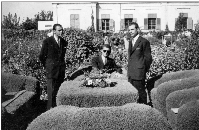
Στο δημοτικό πάρκο.

τέτοια ιστορία κατέγραψε ο συγγραφέας και λαογράφος Νίκος Κοσμάς που διασώθηκε σαν τραγούδι: