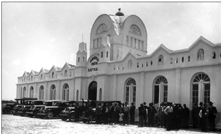
Τα Λουτρά (1930).

κάποιον να πατάει με τα πόδια του ώστε να γεμίσει καλά το κάρο και βέβαια τα παιδιά δεν έλειπαν από αυτό το παιχνίδι. Όλα αυτά γινόταν στα αλώνια, τα γκερένια όπως τα λέγανε, και στη συνέχεια ξεκινούσαν για το Λαγκαδά, караβάνια ολόκληρα από κάρα, βοϊδάμαξες, ακόμα και δίτροχα κάρα με γαϊδουράκια, όλα στην υπηρεσία του αλωνισμού. Όσοι είχαν αποθήκες, μετέφεραν εκεί τη σοδειά τους, οι άλλοι άδειαζαν ένα δωμάτιο του σπιτιού από τα έπιπλα και έβαζαν το στάρι, μέχρι να έλθει ο καιρός να το πάνε στο μύλο ή στον έμπορο. Το τι παιχνίδια γινόταν μέσα σε κείνα τα δωμάτια, τα γεμάτα με στάρι, δε λέγεται, και παρ' όλη τη φαγούρα που έφερνε η βουτιά στο στάρι, όμως δεν το βάζαμε κάτω και δώστου πιο βαθειά μέσα στο στάρι.