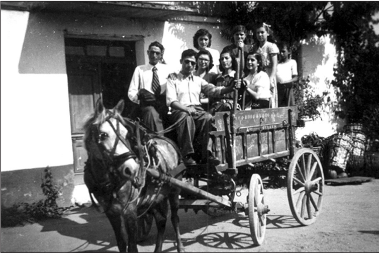
Καροτσάδα για την Πρωτομαγιά.

σει ο καθένας. Τα στεφάνια τοποθετούνταν στα υπέρθυρα των σπιτιών και έμεναν εκεί, μέχρι τη γιορτή του Αγιαννιού (23 Ιουνίου), οπότε και θα τα έκαιγαν στη φωτιά που θ' άναβε σε κάθε γειτονιά, για να πανηγυρίσουν τον άλλο μήνα, τον θεριστή, λέγοντας «έξω ψύλλοι και κοριοί, μέσα υγεία και χαρά και καλή σοδειά». Στο δεύτερο δεκάημερο του Μαΐου η πόλη μας γέμιζε ζωή. Αιτία ήταν η εμποροπανήγυρις που γινόταν στην πόλη και αφορμή της εμποροπανηγύρεως, ήταν η γιορτή των αγίων Κωνσταντίνου και Ελένης. Υπάρχουν παλαιότερες μαρτυρίες ότι την ημέρα της γιορτής αυτής, ξεκινούσε επίσημα η λουτρική περίοδος των θερμοπηγών των Λουτρών του Λαγκαδά. Μάλιστα στα 1909 ο γιατρός Ι. Σιώρης, περιγράφει το αρχαιότατο αυτό βυζαντινό έθιμο, όπου συνάζονταν κόσμος πολύς στα Λουτρά, λειτουργούνταν στο εκκλησάκι