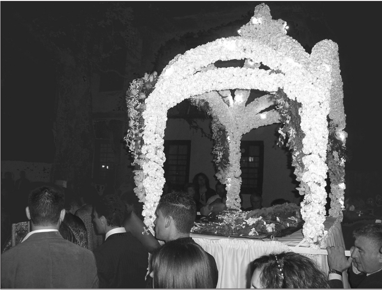
Περιφορά του Επιταφίου Αγίας Παρασκευής.

θανάτω, ο Ιωσήφ θεασάμενος, προσήλθε τω Πιλάτῳ και καθικετεύει λέγων. Δός μοι τούτον τον ξένον, τον εκ βρέφους ως ξένον ξενωθέντα εν κόσμῳ, δος μοι τούτον τον ξένον, ὄν ομόφυλοι, μισούντες, θανατούσιν ως ξένον. Δός μοι τούτον τον ξένον, ὅστις οἶδε ξενίζειν τους πτωχούς και τους ξένους. Δος μοι τούτον τον ξένον ον Εβραῖοι τῳ φθόνῳ αποξένωσαν κόσμῳ. Δος μοι τούτον τον ξένον, ἵνα κρύψω εν τάφῳ, ον ως ξένος ουκ έχει την κεφαλὴν πύ κλίνῃ. Δος μοι τούτον τον ξένον, ον η Μήτηρ ορώσα νεκρωθέντα εβόα: Ω Υιέ και Θεέ μου, ει και τα σπλάχνα τιτρώσκωμαι και καρδίαν σπαράττομαι, νεκρόν καθορώσα, αλλά τη ση αναστάσει θαρρούσα, μεγαλύνω. Και τούτοις τοις λόγοις δυσωπών τον Πιλάτον ο ευσχήμων,