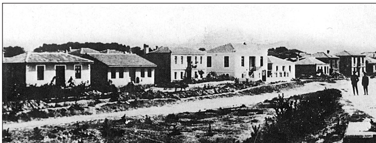
Τα προσφυγικά του Λαγκαδά.

Κι ύστερα άμα πέρασαν χρόνοι και καιροί κι ήρθαν εχτροί και καταχτητές, εκείνοι έμειναν πιστοί στο φρόνημα και στη λαλιά τους την ελληνική.