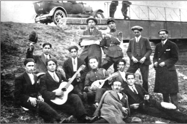
Κανταδόροι, στην μικρή γέφυρα (1930).

μωνιατικό κρύο «Ξύπνα μικρό μου κι άκουσε κάποιο μινόρε της αυγής». Έξω το φως λιγοστό, από νωρίς γκρίζα σύννεφα είχαν σκεπάσει την πόλη, η ομίχλη τραβήχτηκε, κι έδωσε τη θέση της σε ένα καιρό χιονιά και οι χήνες πέταξαν προς τη λίμνη! σημάδι πως πλησίαζε χιονιάς. Δεν ξεχώριζα πρόσωπα κανταδόρων, όμως ήταν οι ίδιοι που εδώ και πολύ καιρό πολιορκούσαν τη γειτονιά μας ασφυκτικά, μέχρι να «πέσει» το «κάστρο» που ονειρεύονταν. Είχα μάθει πλέον τις φωνές τους και όλοι τους γνωρίζαμε, όπως είχαμε μάθει και το ρεπερτόριο τους απ' έξω. Η γιαγιά μόλις άκουσε το πρώτο τραγούδι έλεγε με πονηρό χαμόγελο «άντε ήρθαν πάλι οι γαμπροί της γειτονιάς μας». Τη δική μου περιέργεια να δω ποιοί τραγουδούσαν, την είχαν κι άλλοι στη γειτονιά, κι άλλοι μεν κρυμμένοι πίσω από τις κουρτίνες προσπαθούσαν να ξεχωρίσουν