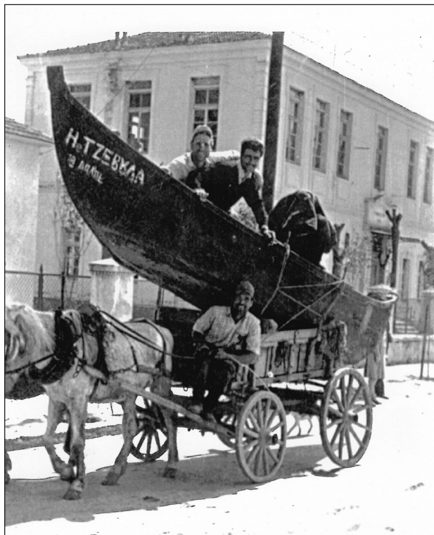
Μεταφορά της βάρκας στη λίμνη.