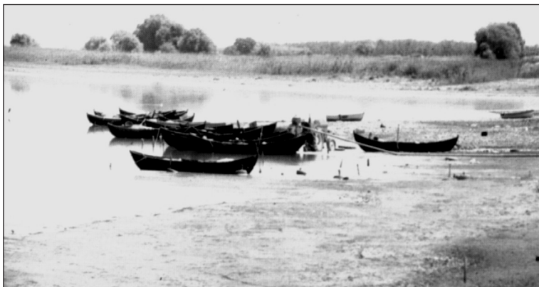
Η λίμνη Κορώνεια, 1980.

γιατί όντως δόθηκαν εκατοντάδες εκατομμύρια για μελέτες, που όμως δεν προχώρησαν ποτέ σε υλοποίηση. Ακόμα και τα τελευταία μεγάλα και σοβαρά για την περιοχή μας έργα, που στόχο είχαν να ενισχύσουν τους υδάτινους πόρους της λίμνης και να αξιοποιήσουν τα νερά των ρεμάτων, παραμένουν ανενεργά, γιατί δεν είναι να φτιάξεις ένα έργο, αλλά τα έργα θέλουν συντήρηση και παρακολούθηση. Για παράδειγμα η μεγάλη τάφρος που έγινε στο Σχολάρι για να μεταφέρει νερό στην Λίμνη, έχει πλέον αχρηστευθεί γιατί από τότε που έγινε δεν καθαρίστηκε ποτέ με αποτέλεσμα σήμερα να έχει γεμίσει με φερτά υλικά, να έχει μετατραπεί σε ένα μικρό δασίλειο, και να μη μπορεί να λειτουργήσει η μεταφορά νερών. Τρομάζω πραγματικά με την πλήρη αδιαφορία και τον κυνισμό των αρμοδίων φορέων. Τέτοια ανευθυνότητα, πραγματικά φοβίζει τον κάθε πολίτη, που θέλει να ζει σε μια περιοχή πολλαπλά ευλογημένη. Ακόμα οι κατά νόμον υπεύθυνοι φορείς, Περι-