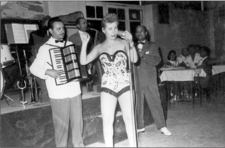
Από λαϊκό πρόγραμμα σε ταβέρνα του Λαγκαδά.