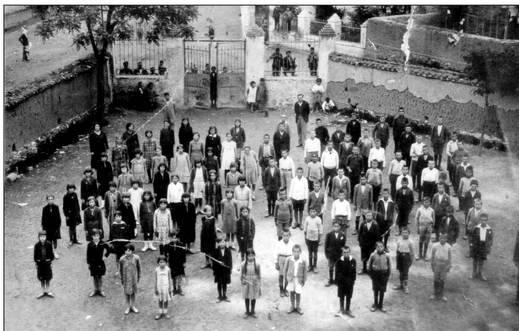
Στην αυλή του Α΄ Δημοτικού (1948).