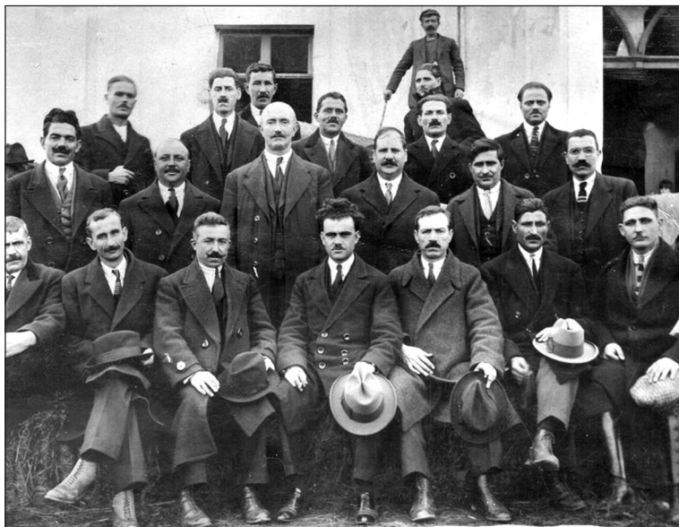
Οι επαγγελματίες του Λαγκαδά.

μνήμη μου οι διαδηλώσεις στον Λαγκαδά, για την εκλογή Δημάρχου, επειδή τότε ο Δήμαρχος δεν εκλέγονταν από τον λαό αλλά από το Δημοτικό Συμβούλιο και ο τότε μειοψηφίας στις εκλογές, κατάφερε να εκλεγεί Δήμαρχος, εξαγοράζοντας προφανώς τους συμβούλους της πλειοψηφίας. Επειδή δε την ώρα που πήγαιναν για την εκλογική διαδικασία, κέρασε τους συμβούλους από μία καραμέλα, (όντας μπακάλης στο επάγγελμα) το σύνθημα που επικράτησε στις διαδηλώσεις ήταν «ο Ιούδας με το φίλημα κι' αυτός με καραμέλα». Οι εφημερίδες της εποχής αναφέρουν πολλά περιστατικά για την εποχή αυτή, και για τους θερμόαιμους Λαγκαδιανούς που οδηγήθηκαν στον εισαγγελέα, γιατί έριξαν πέτρες στο σπίτι του Δημάρχου και η