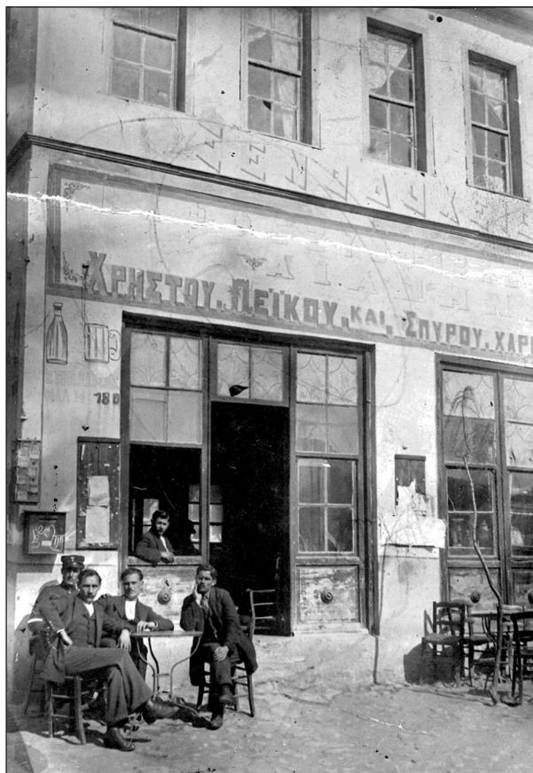
Ξενοδοχείο Πείκου-Χαρίτου (1911).

από την πλατεία μέχρι το μύλο του ΓΕΩΡΓΙΑΔΗ, και όλο το τετράγωνο που περικλείεται από την Σεραφεΐμ Τσακμάνη, ο Λαγκαδάς είχε 217 καταστήματα. Μετράμε σ' αυτά 27 μπακάλικα, 25 καφενεία, 15 κουρεία, 15 τσαγκαράδικα, 10 υφασματοπωλεία, 10 καρποποιεία, 5 πεταλωτήρια, 5 σαγματοποιεία, 3