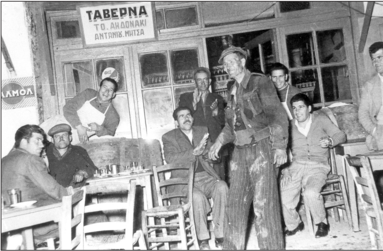
Γλέντι στο «Αηδονάκι».

Μετά το απόγευμα με το πρώτο αεράκι γινόταν το λίχνισμα με τα λιχνιστήρια, δηλαδή ξύλινα φτυάρια που πετούσαν τα στάχια ψηλά, και το μεν σάρι έπεφτε κάτω, τα δε άχυρα ο αέρας τα πήγαινε παραδίπλα, ξεχώριζε δηλαδή «η ήρα από το σάρι». Κι ύστερα α!!! ύστερα!!! να μπει το σάρι στα τσουβάλια, να φορτωθεί το άχυρο στα κάρα και μεις να χοροπηδάμε πατώντας τα άχυρα για να γεμίζει καλά το κάρο, που στο μεταξύ αποκτούσε διαστάσεις φορηγού, καθώς με ειδικά ξύλινα κοντάρια, τις κλιμιές, έδιναν ύψος στο κάρο και αποκτούσε μεγαλύτερη χωρητικότητα. Η φαγούρα βέβαια δεν περιγράφεται, αλλά μπρος στο παιχνίδι και στην πλάκα τι ήταν ο πόνος! Οι αγροτικές εργασίες περιλάμβαναν ακόμα και την περιποίηση των μπαξέδων που καθιστούσαν την επαρχία μας πραγματικό παράδεισο, καθώς παράγονταν κάθε λογής ζαρ-