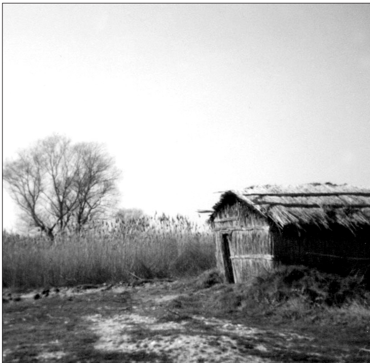
Ψαροκαλύβα της λίμνης.

θλιβερό, αλλά και ανθρώπων που έζησαν «ζωή χαρισάμενη», κάνοντας master plan και μελέτες επί μελετών, τρώγοντας ασύστολα τα λεφτά της Ευρώπης. Κανένας δε πήγε φυλακή, γιατί κανένας δεν είχε το κουράγιο να τους καταγγείλει, οι όποιες δε καταγγελίες έγιναν από ιδιώτες, καταδίκασαν τελικά τη χώρα μας σε μεγάλα πρόστιμα, τα οποία πλήρωσαν όχι αυτοί που έφταιγαν, αλλά ο δημόσιος κορβανάς, δηλαδή εσείς και εγώ.