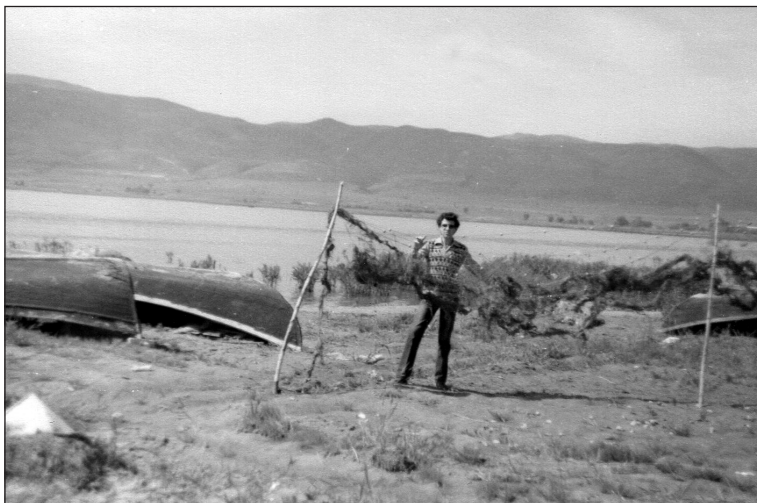
Η παραλία της Κορώνειας.

Τι πρέπει να γίνει; Μια πανστρατιά, Δημάρχων, φορέων, συλλόγων, πολιτών, μαθητών, επιστημονικών και επαγγελματικών κοινοτήτων. Να τεθεί το θέμα στη Βουλή, να καταλογιστούν ευθύνες αν υπάρχουν καθυστερήσεις έργων, εν ανάγκη να επέμβει κάποιος εισαγγελέας να βγάλει μια άκρη. Δεν μπορεί να συνεχίζει η κατάσταση έτσι. Είναι ντροπή για τη χώρα μας, για τον τόπο μας να μη φροντίζουμε για τα αυτονόητα. Όταν πριν από 8 χρόνια ήλθαν ως επισκέπτες στον Δήμο μας 2 λεωφορεία Τούρκοι, με μια Δήμαρχο και έναν Αντινομάρχη, από την περιοχή της Σμύρνης, των οποίων οι πρόγονοι κατοικούσαν στην επαρχία μας προ της ανταλλαγής του 1922, είχα τη χαρά να τους ξεναγώ στην περιοχή μας. Όταν περάσαμε από την Κορώνεια είδαν το αποκαρδιωτικό θέαμα και τους εξήγησα την ιστορία, μου απάντησαν πολύ φυσιολογικά οι