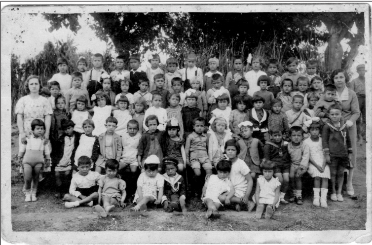
Νηπιαγωγείο Λαμαδα 1934

να νύχια, ήταν στην καθημερινή ημερησία διάταξη κατά τον έλεγχο που γινόταν από τους δασκάλους. Άλλαξε η απαίτηση του χειμώνα να κουβαλάμε από ένα ξύλο ο καθένας για την σόμπα της τάξης, άλλαξε η ανάγκη να πίνουμε το γάλα σκόνη κατά την προσέλευσή μας στο σχολείο. Σήμερα με τα τόσα που έχουμε, το σχολείο αδυνατεί να στηρίξει τους μαθητές που έχουν ανάγκη από ένα πρωινό. Τότε, περί το 1963 σε εποχές κρίσης, το σχολείο μοίραζε, γάλα σκόνη, ζάχαρη, κασέρι κίτρινο, και ρούχα σταλμένα από την UNRA. Αυτό δε που άλλαξε ριζικότερα είναι η «παράδοση» να ζητά από την αρχή της χρονιάς ο Δάσκαλος μια καλή βέργα ει δυνατόν από κρανιά, για τον σωφρονισμό των μαθητών και την επιβολή της τάξης,