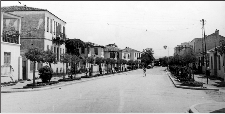
Η οδός Μεγ. Αλεξάνδρου από το Α΄ Δημοτικό.

νίκης. Τα περίφημα ευρήματα του Δερβενίου, της Ασσήρου, του Λέοντα της Μυγδονίας που βρέθηκε στον Ευαγγελισμό στις 25-10-1978, τα τελευταίως ανευρεθέντα στην περιοχή μεταξύ Γερακαρούς και Βασιλουδίου, που φυλάσσονται για συντήρηση στο μουσείο της Αθήνας, περικεφαλαίες και προσωπεία ολόχρυσα, καθώς και χρυσά σπαθιά, μαρτυρούν μια περιοχή πλούσια σε πολιτισμό και ιστορία. Οι μακεδονικοί τάφοι των Λαγυνών, οι τούμπες Περιβολακίου και Καβαλαρίου, τα βυζαντινά κτίσματα της Απολλωνίας και του πύργου του Αγ. Βασιλείου στην παραλίμνια περιοχή της Κορώνειας, το μακεδονικό νεκροταφείο έξω από τη Γερακαρού που βρέθηκαν όπλα και περικεφαλαίες καταπληκτικής τέχνης, αποτελούν ισχυρά τεκμήρια της ιστορικής πορείας του λαού και περιμένουν την ανάδειξή τους από τους αρμόδιους δημοτικούς φορείς. Στη βυζαντινή και μεταβυζαντινή περίοδο αυτή η πολιτισμική πορεία συμπληρώνεται με τα μνημεία βυζαντι-