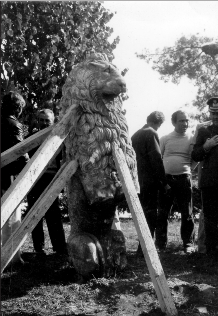
Ο Λέων της Μυγδονίας.