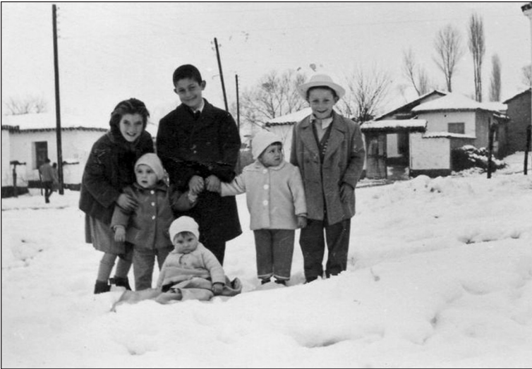
Χιόνια στη Μικρά Ελβετία Λαγκαδά.

μάνα πάντα φώναζε: Πάρτε μαζί σας και καμιά σακούλα για τα φρούτα. Αν και δυσανασχετούσαμε, τελικά παίρναμε πάντα σακούλα, γιατί ήταν η μόνη που γέμιζε πάντα με φρούτα γλυκά και καλούδια, ενώ το κουτί μάζευε λίγα μισόφραγκα, δεκάρες, που ήταν τότε στη κυκλοφορία, καμιά δραχμή, από κάποιον στενό συγγενή, και βέβαια όταν τραγουδούσαμε το βράδι, έριχναν κάποιοι μέσα στο ταμείο ό,τι παλιό νόμισμα είχαν από την κατοχή, ή ακόμα και μεταλλικά κουμπιά.