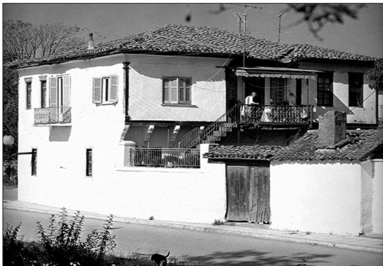
Οικία Βενιώτη (1998).

στην πολυκατοικία», και είχε ακόμα 50-60 σπίτια, στολίδια αρχιτεκτονικής και εκπληκτικής αισθητικής. Σήμερα τί;