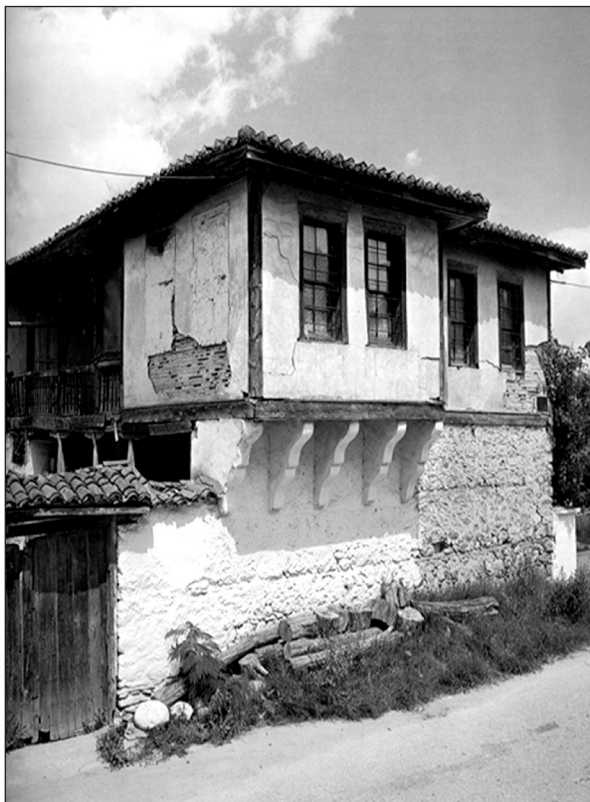
Οικία Δούγκα (1998).

σκευή που όμοιά της η επιστήμη συναντά στην Κωνσταντινούπολη και στη Βουλγαρία.