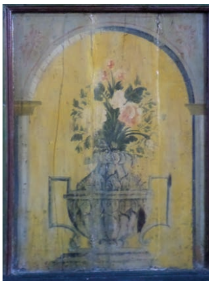
Εικ. 28. Τέμπλο Ξυλουπόλεως.