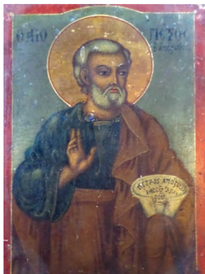
Εικ. 31. Ο απόστολος Πέτρος.