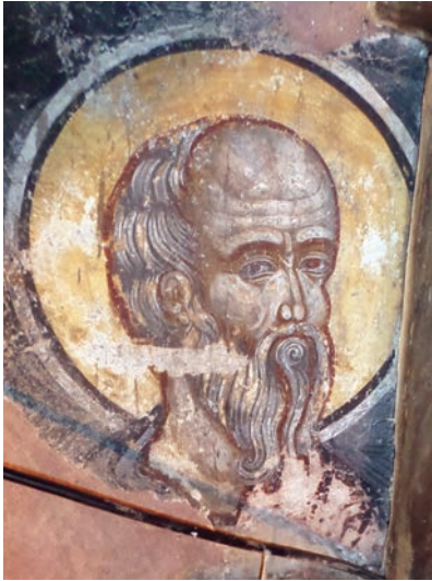
Εικ. 24. Αδιάγνωστος άγιος (τοιχογραφία).