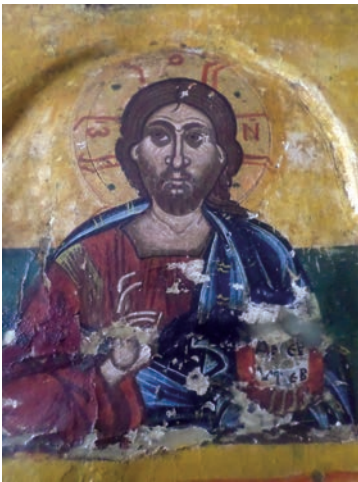
Εικ. 8β. Ο Χριστός (λεπτομέρεια).