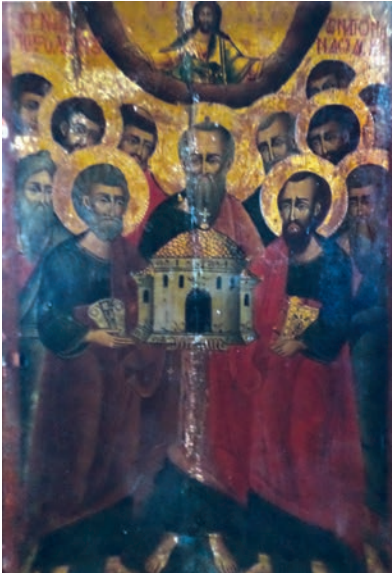
Εικ. 4. Οι άγιοι Απόστολοι.