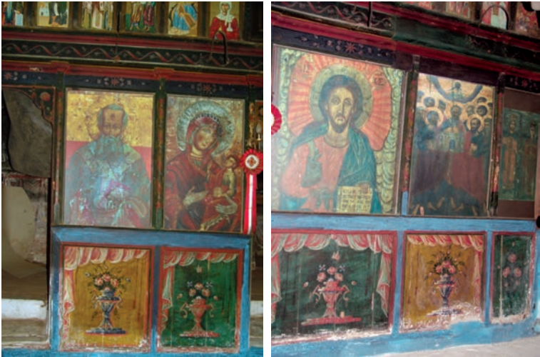
Εικ. 40. Το τέμπλο.