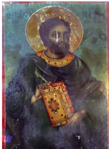
Εικ. 12. Άγιος Μάρκος.