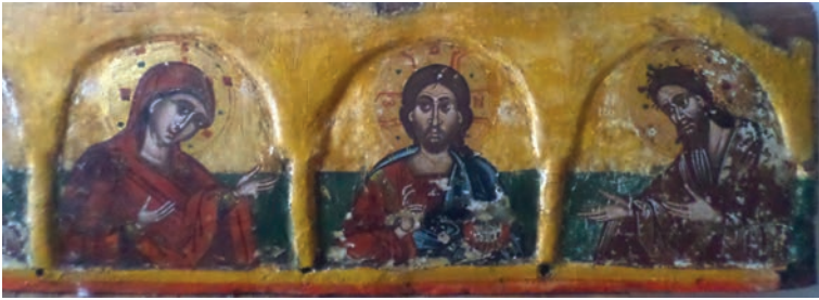
Εικ. 7. Τρίμορφο των Αποστολικών.