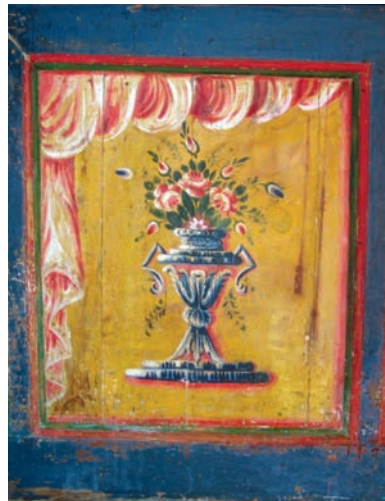
Εικ. 44. Λεπτομέρειες του τέμπλου του ναού πριν (πάνω) και μετά (κάτω).