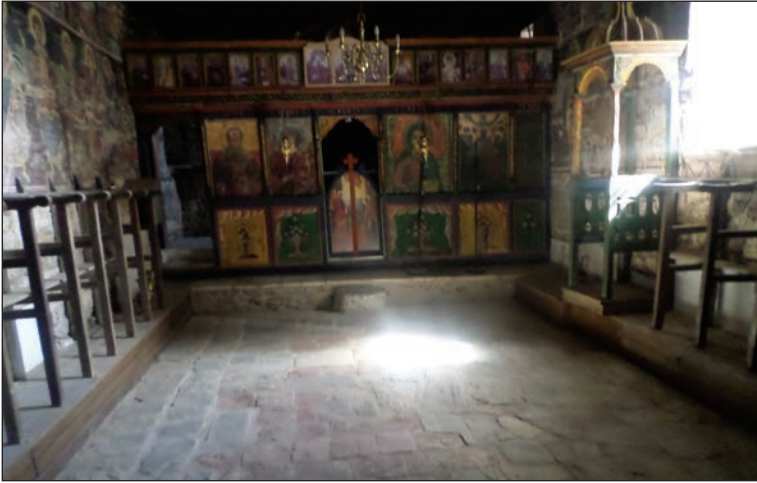
Εικ. 1. Το τέμπλο.