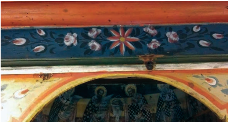
Εικ. 42. Λεπτομέρειες του τέμπλου του ναού μετά τις επεμβάσεις.