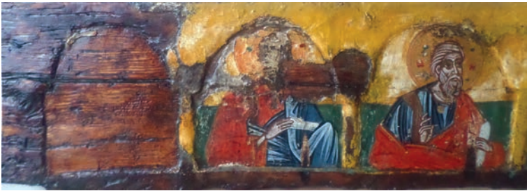
Εικ. 8α. Τα αποστολικά (λεπτομέρεια).