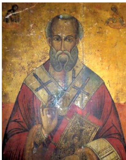
Εικ. 29. Ο άγιος Νικόλαος.