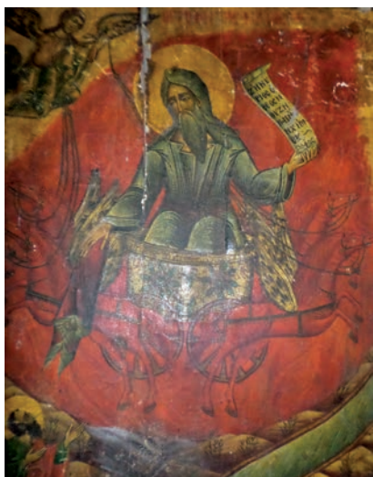
Εικ. 30. Ο προφήτης Ηλίας.