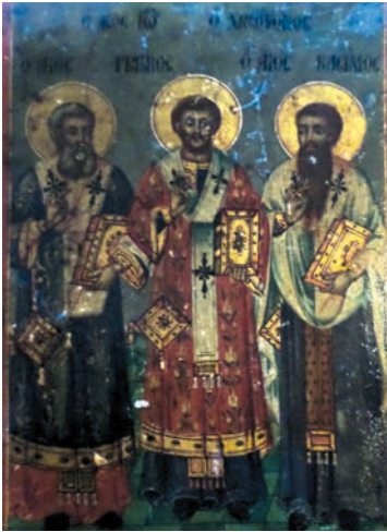
Εικ. 13. Οι Τρεις Ιεράρχες.