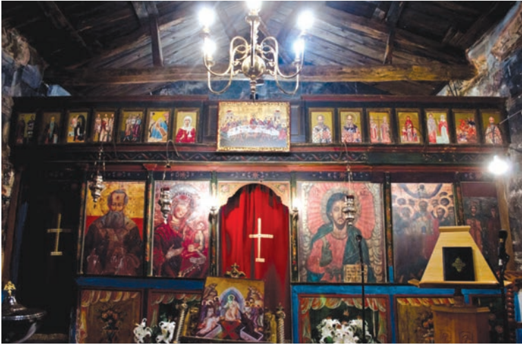
Εικ. 39. Το τέμπλο του ναού πριν τις επεμβάσεις.