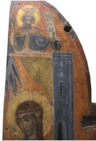
Εικ. 17α. Λεπτομέρεια.