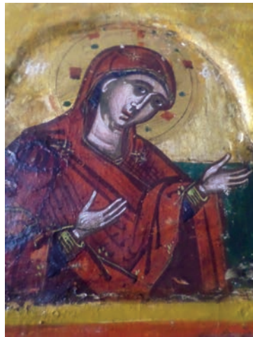
Εικ. 8γ. Η Θεοτόκος (λεπτομέρεια).