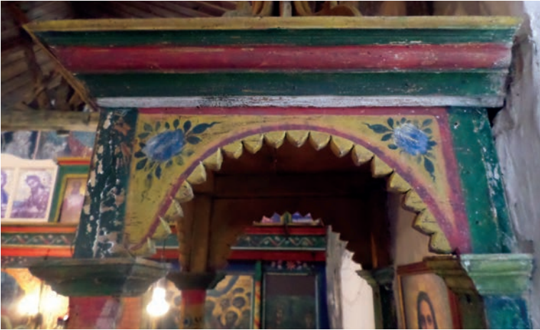
Εικ. 35. Διακόσμηση του δεσποτικού θρόνου.