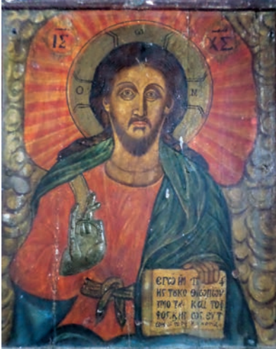
Εικ. 2. Ο Χριστός Παντοκράτωρ.