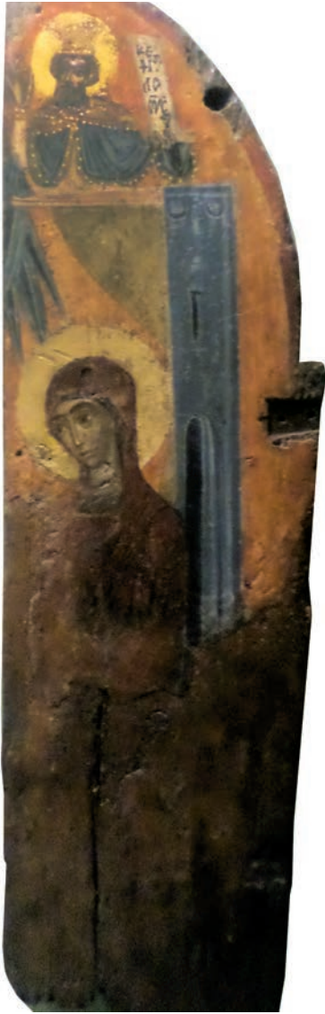
Εικ. 17. Το βημόθυρο.