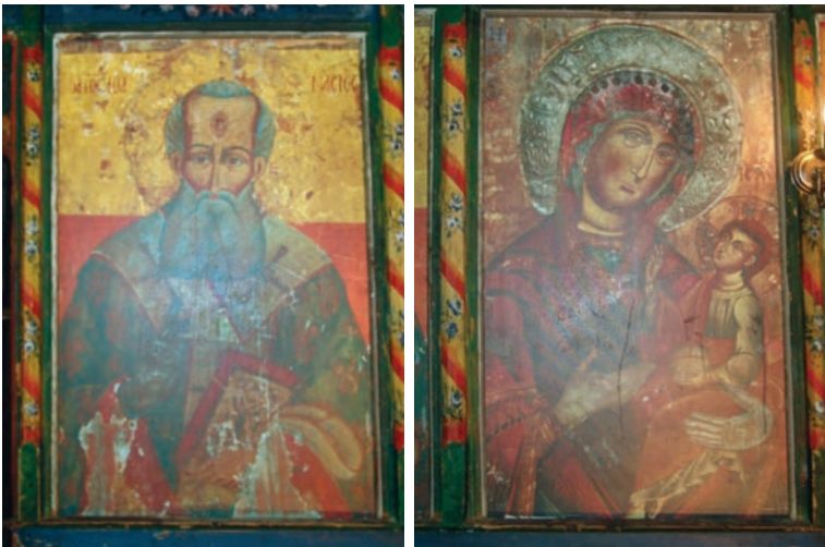
Εικ. 43. Λεπτομέρειες του τέμπλου του ναού μετά τις επεμβάσεις.