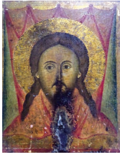
Εικ. 10. Άγιο Μανδήλιο.