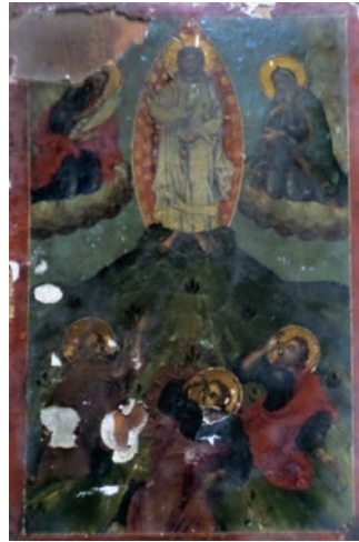
Εικ. 14. Η Μεταμόρφωση.