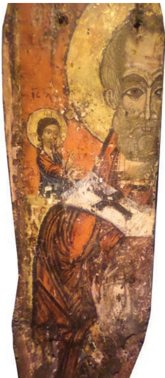
Εικ. 18. Ο άγιος Νικόλαος (σπάραγμα).