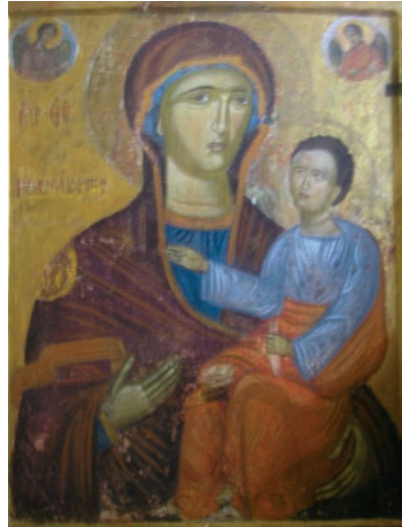
Εικ. 25. Παναγία η Παμμακάριστος.