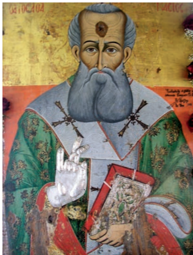
Εικ. 6. Ο άγιος Αθανάσιος.