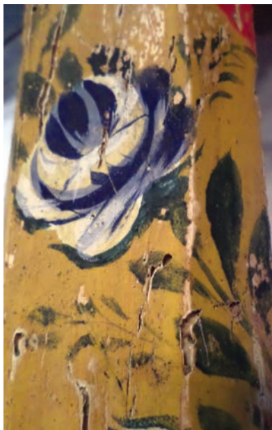
Εικ. 23. Ο φυτικός διάκοσμος.