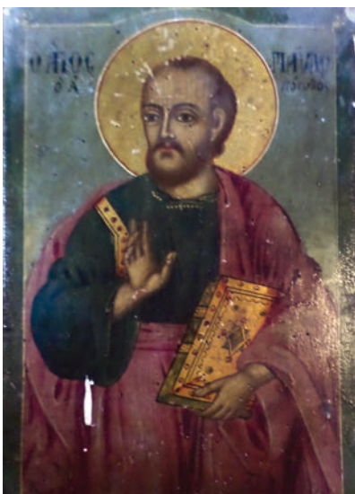
Εικ. 32. Ο απόστολος Παύλος.