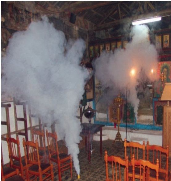
Εικ. 38. Απεντόμωση με υποκαπνισμό.