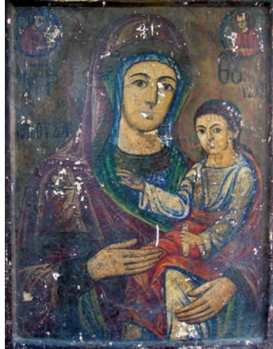
Εικ. 3. Παναγία η Ελεούσα.