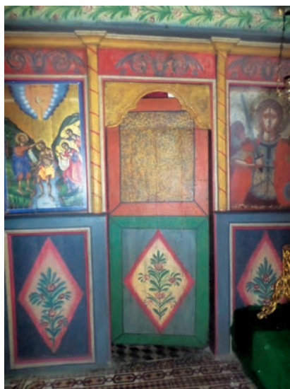
Εικ. 27. Τέμπλο Βερτίσκου.