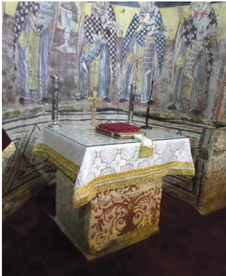
Εικ. 36. Η αγία Τράπεζα και η αφίδα του βήματος.