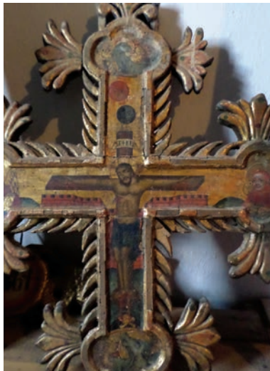
Εικ. 19. Ο σταυρός του τέμπλου.