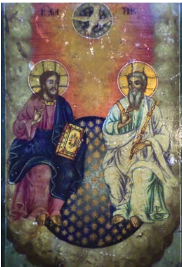
Εικ. 11. Αγία Τριάδα.