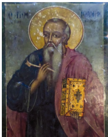
Εικ. 33. Ο άγιος Ιωάννης Θεολόγος.