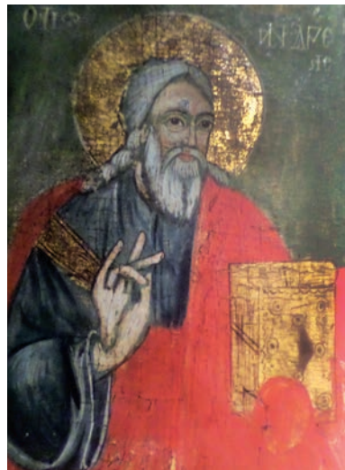
Εικ. 16. Ο άγιος Ανδρέας.