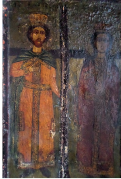
Εικ. 5. Άγιος Κωνσταντίνος και Ελένη.