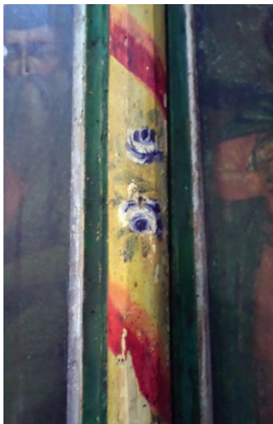
Εικ. 22. Κιονίσκος του τέμπλου.