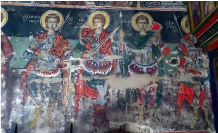
Εικ. 26. Τοιχογραφίες, βόρειος τείχος.