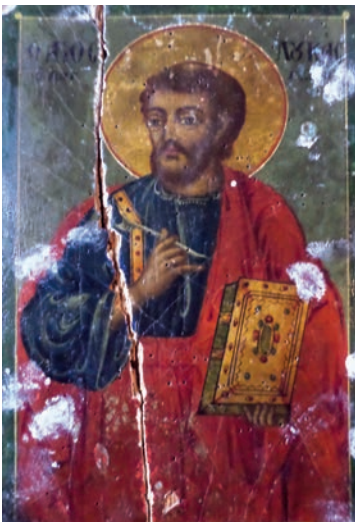
Εικ. 15. Ο άγιος Λουκάς.