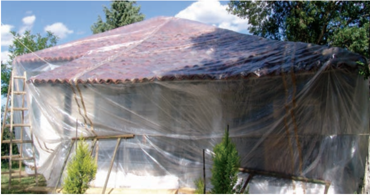
Εικ. 37. Κάλυψη όλων των ανοιγμάτων και του ναού εξωτερικά με μεμβράνη πολυαιθυλενίου και εφαρμογή καπνογόνων εντομοκτόνων.