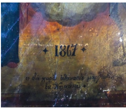
Εικ. 34. Χρονολόγηση εικόνας.