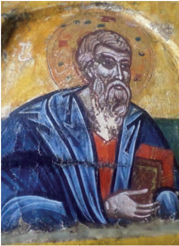
Εικ. 9. Άγιος Πέτρος Αποστολικός.