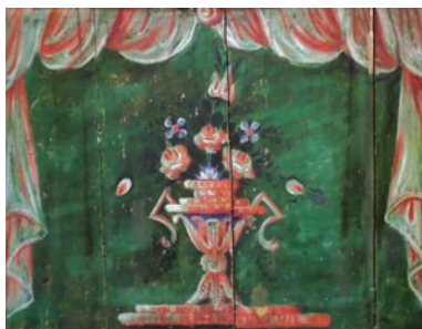
Εικ. 21. Θωράκιο.