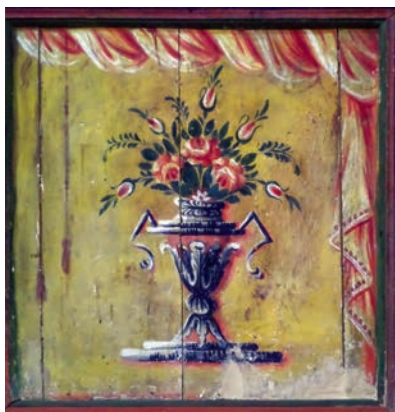
Εικ. 20. Θωράκιο.