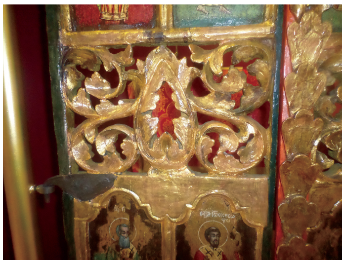
Εικ. 13. Λεπτομέρεια.