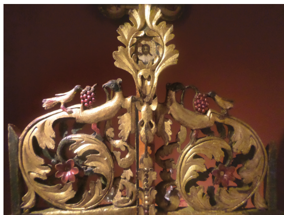
Εικ. 9. Λεπτομέρεια.