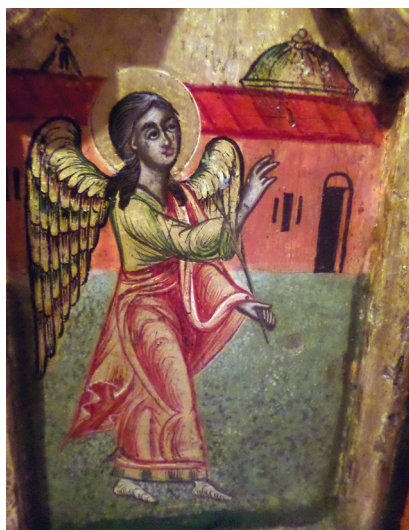
Εικ. 16. Άγγελος του Ευαγγελισμού.