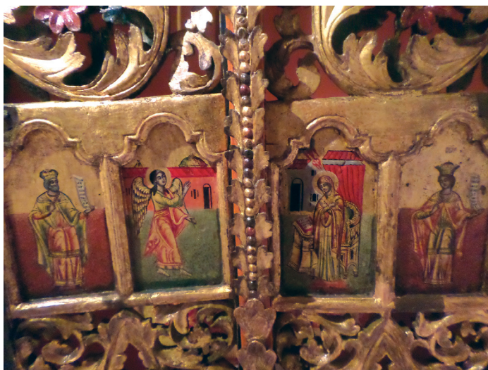
Εικ. 10. Λεπτομέρεια, η εικονογράφηση.