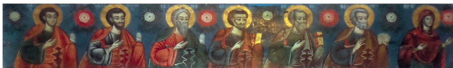
Εικ. 6. Αποστολικά.