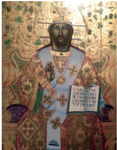
Εικ. 20. Ο Χριστός.