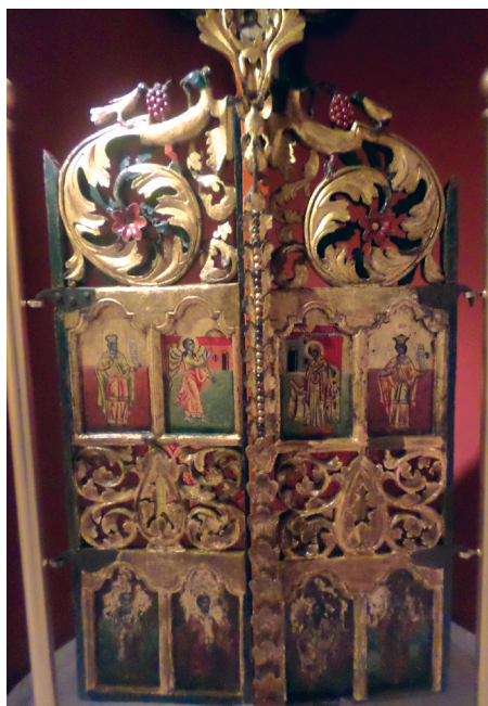
Εικ. 8. Βημόθυρα.