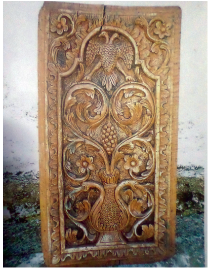
Εικ. 19. Θωράχιο.