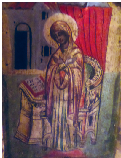
Εικ. 17. Ευαγγελισμός, η Θεοτόκος.