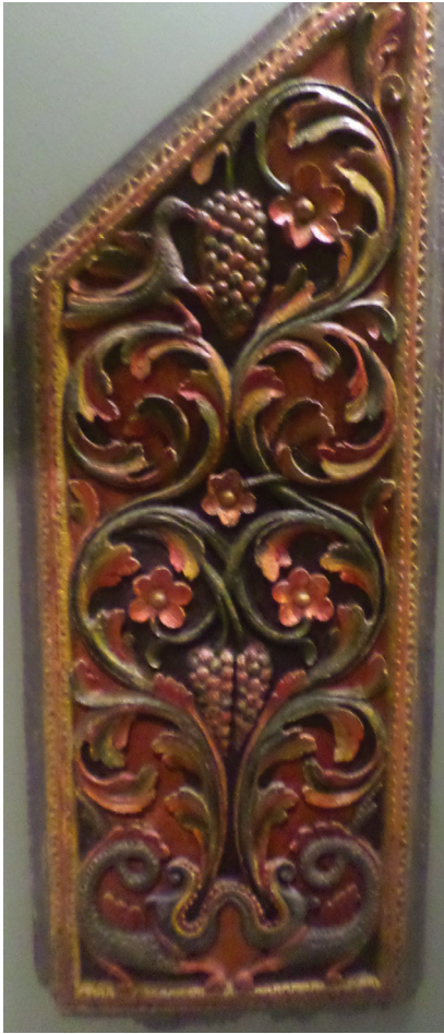
Εικ. 18. Βημόθυρο.