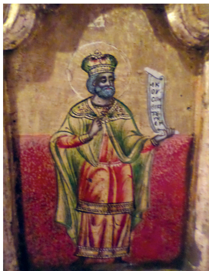
Εικ. 14. Ο προφήτης Δαβίδ.