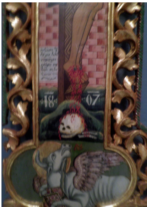
Εικ. 5. Χρονολογία, λεπτομέρεια.