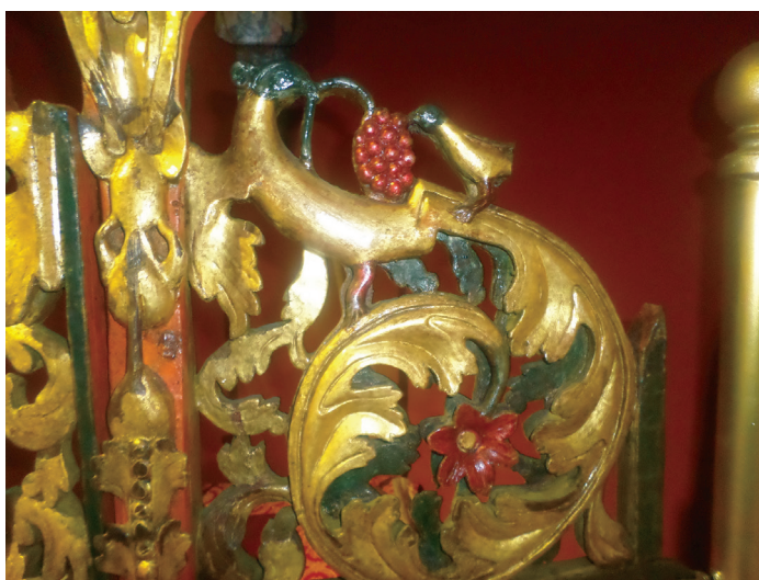
Εικ. 11. Λεπτομέρεια.