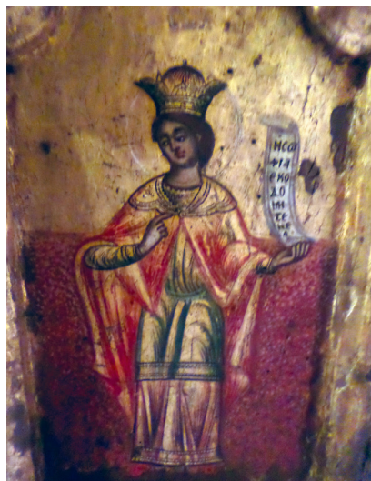
Εικ. 15. Ο προφήτης Σολομών.