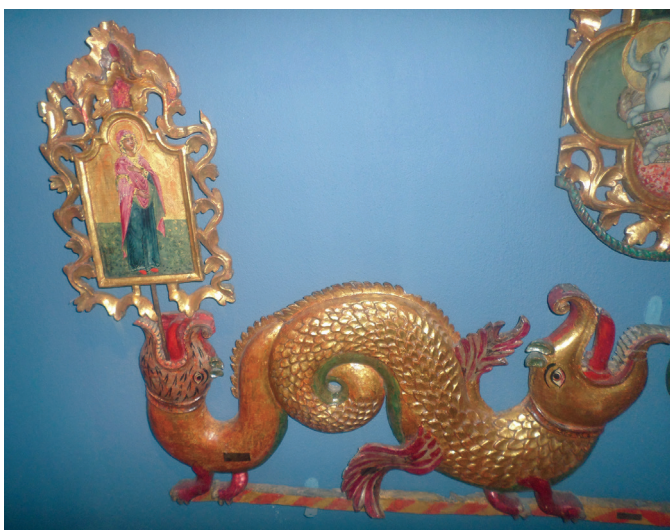
Εικ. 4. Λεπτομέρεια.