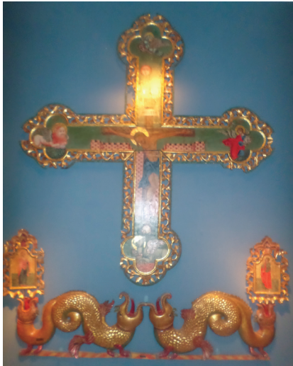
Εικ. 2. Σταυρός με τα λυπηρά.