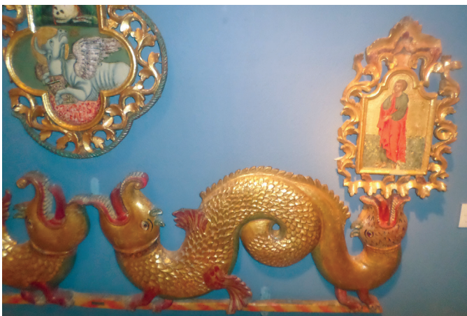
Εικ. 3. Λεπτομέρεια δρακόντων.