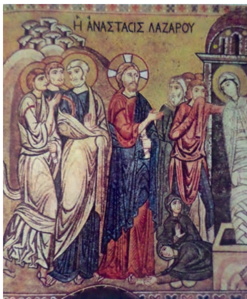
Εικ. 10. Μωσαϊκό 12ου αι. Παλέρμο, Σικελία.