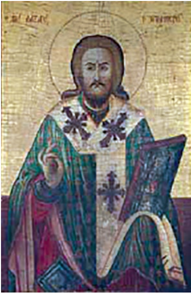
Εικ. 25. Ο άγιος Λάζαρος με αρχιερατική αμφίεση.