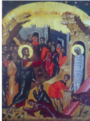
Εικ. 2. Η Έγερση, 16ος αι.