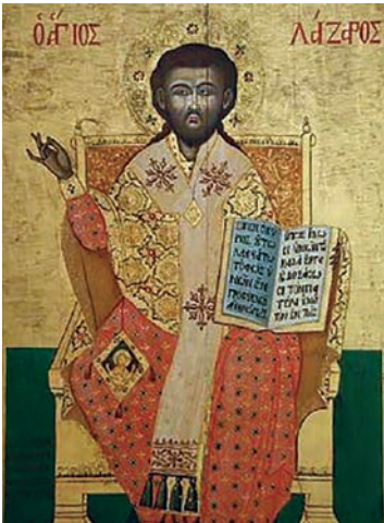
Εικ. 23. Ο άγιος Λάζαρος και επίσκοπος.