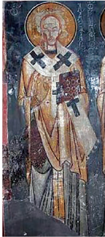
Εικ. 26. Ο επίσκοπος άγιος Λάζαρος.