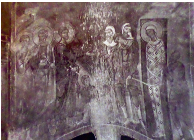
Εικ. 13. Η Έγερσις του Λαζάρου.