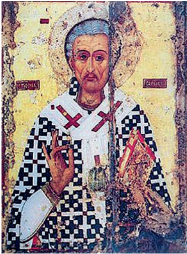
Εικ. 1. Φορητή εικόνα του αγίου Λαζάρου, στον ναό του αγίου στην Κύπρο.