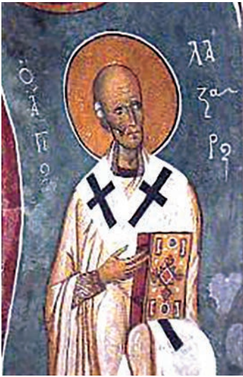
Εικ. 21. Άγιος Λάζαρος. Τοιχογραφία από την Παναγία του Άρακα Κύπρου, 1192.