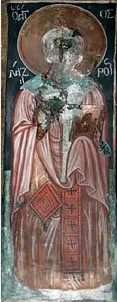
Εικ. 27. Ο επίσκοπος άγιος Λάζαρος.