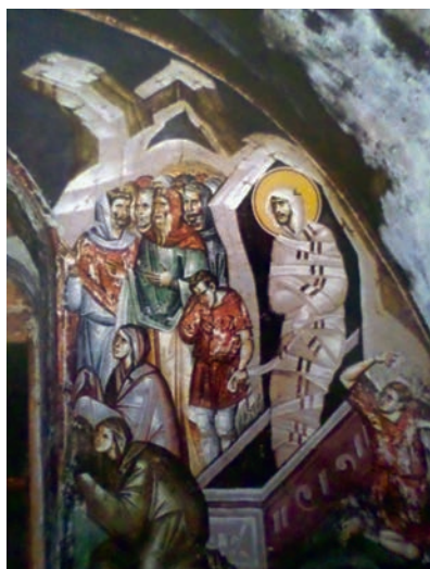
Εικ. 19. Ο Λάζαρος στον τάφο, λεπτομέρεια.