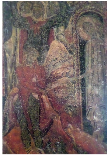
Εικ. 15. Η Έγερσις του Λαζάρου.