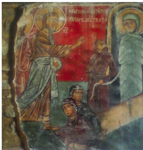
Εικ. 12. Δυτικός τοίχος (Δ-Δ, 20), 1280.