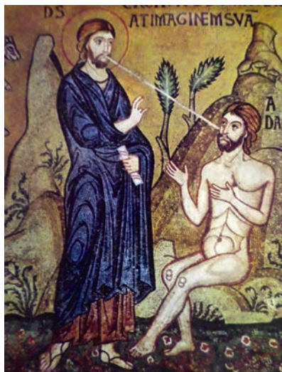
Εικ. 17. Η Δημιουργία, Παλέρνο.