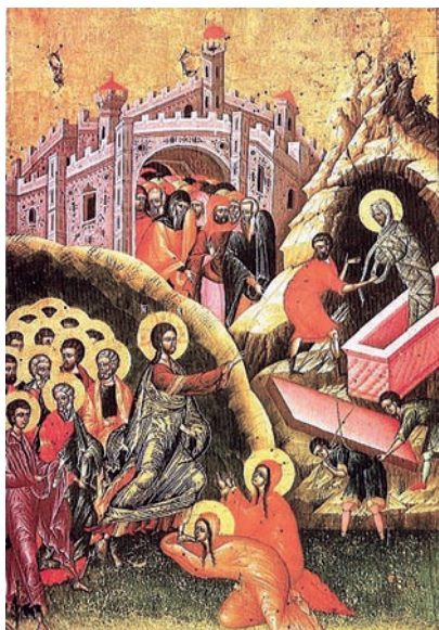
Εικ. 6. Η Έγερσις του Λαζάρου, Κύπρος.