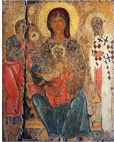
Εικ. 28. Άγιος Λάζαρος και Θεοτόκος, Ναός Αγγελόκτιστης Κύπρου.