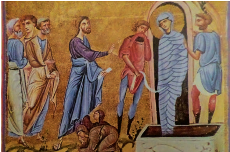
Εικ. 3. Έγερση Λαζάρου, μικρογραφία χειρογράφου.