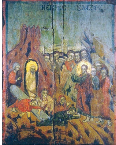
Εικ. 31. Έγερση του Λαζάρου, Προφήτης Λαγκαδά.