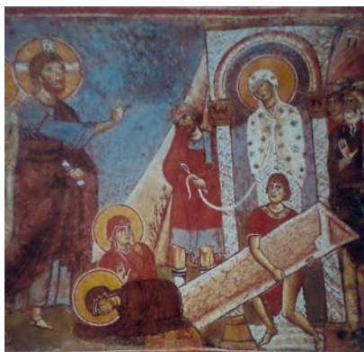
Εικ. 18. Κύπρος, Παναγία της Ασίνου.