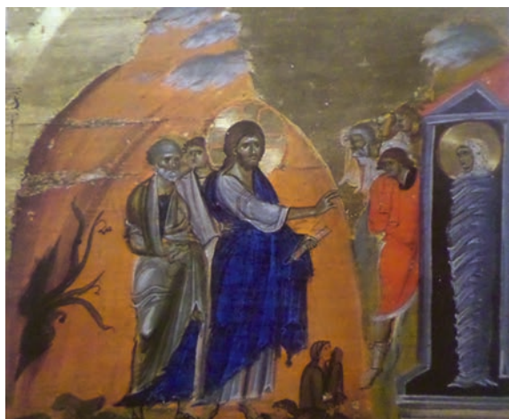
Εικ. 11. Η Έγερσις του Λαζάρου, επιστήγιο Μ. Σινά, 12ος αι.