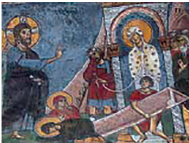
Εικ. 9. Η Έγερσις του Λαζάρου.