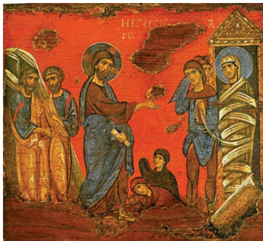
Εικ. 7. Η Έγερσις του Λαζάρου, Κύπρος.