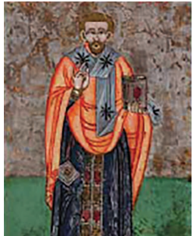
Εικ. 24. Ο επίσκοπος Άγιος Λάζαρος.