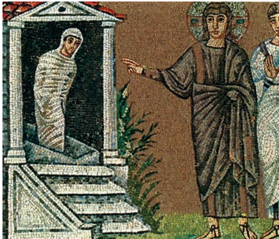
Εικ. 5. Η Έγερσις, Ραβέννα.