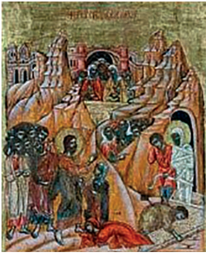
Εικ. 14. Η Έγερσις του Λαζάρου.