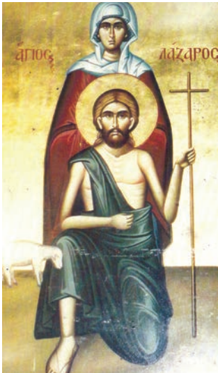
Εικ. 32. Άγιος Λάζαρος, Ευαγγελισμός Λαγκαδά.