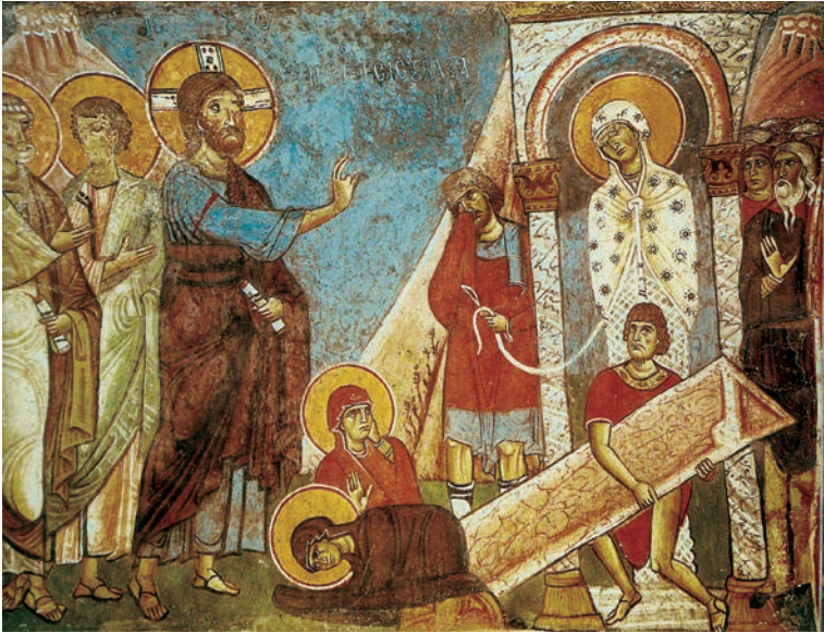
Εικ. 4. Η Έγερσις του Λαζάρου, Κύπρος.