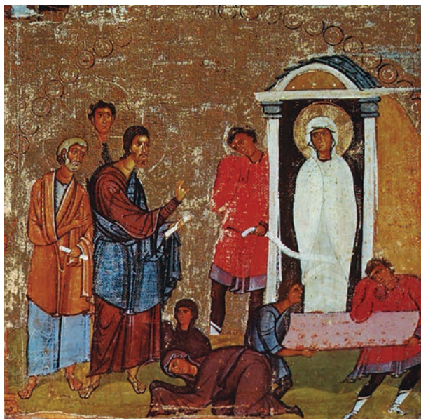
Εικ. 8. Η Έγερσις του Λαζάρου.