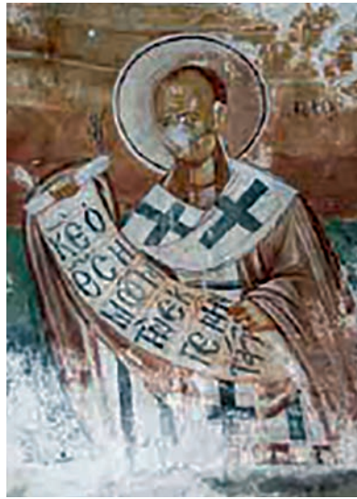
Εικ. 22. Άγιος Λάζαρος 15ος αι. Ναός Αγίου Ανδρονίκου Λιοπετρίου.