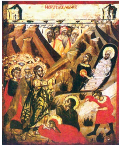
Εικ. 29. Άγιος Γεώργιος Μελισσοχωρίου.