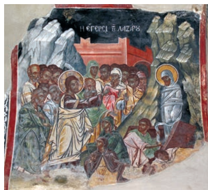
Εικ. 20. Μονή Καισαριανής.