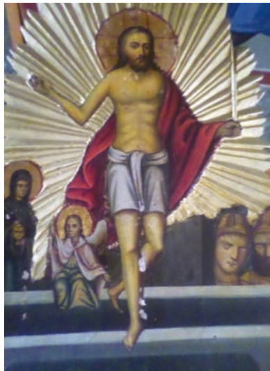
Εικ. 33. Ανάσταση του Χριστού, διά χειρός Γ. Παπαγεωργίου.