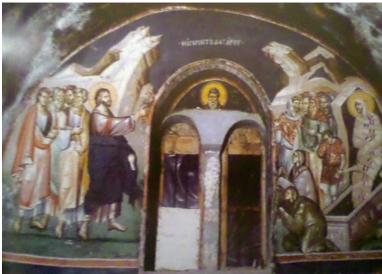
Εικ. 16. Η Έγερσις του Λαζάρου.