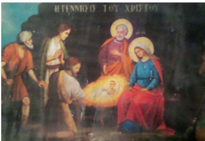
Εικ. 10. Η Γέννηση του Κυρίου.