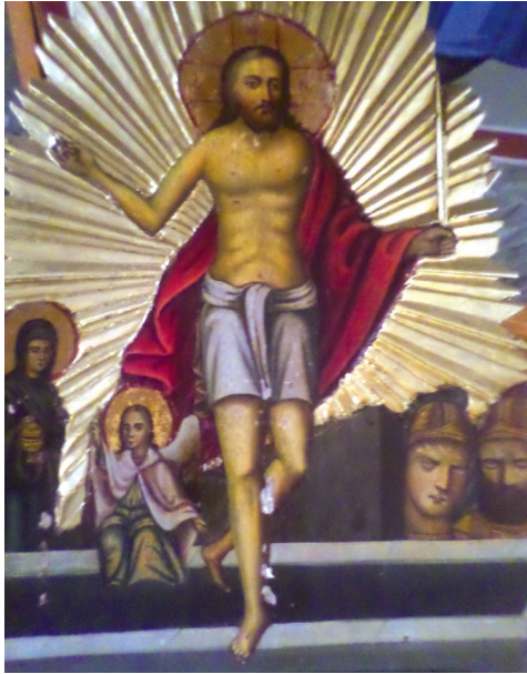
Εικ. 3. Λάβαρο Αναστάσεως Μητροπολιτικού Ναού Λαγκαδά.