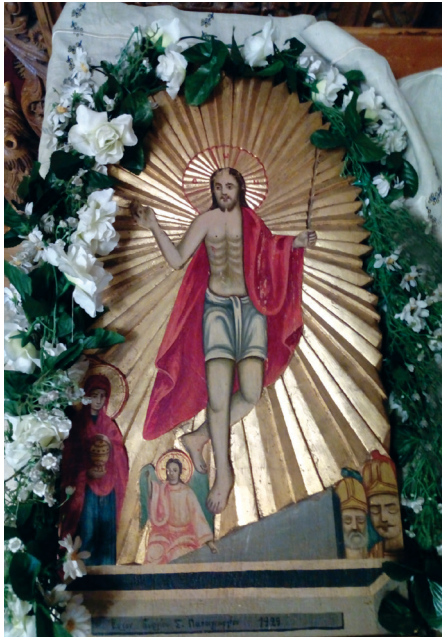
Εικ. 5. Λάβαρο Αναστάσεως Ναού Κοιμήσεως Θεοτόκου.