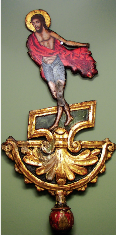
Εικ. 7. Λάβαρο του εκκλησιαστικού Μουσείου Λαγκαδά.