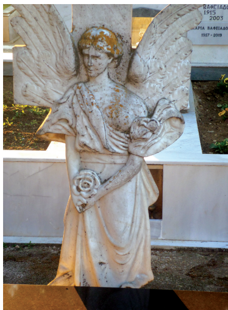
Εικ. 13. Ο τάφος του ζωγράφου Γ. Παπαγεωργίου.