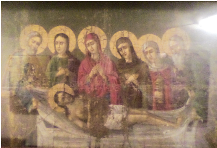
Εικ. 2. Επιτάφιος Ναού Κοιμήσεως Θεοτόκου Λαγκαδά.