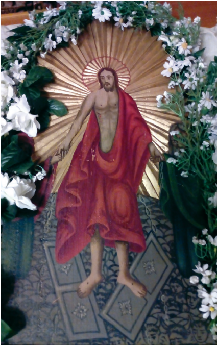
Εικ. 6. Λάβαρο Ι. Ν. Κοιμήσεως Θεοτόκου, η «εις Άδου κάθοδος».