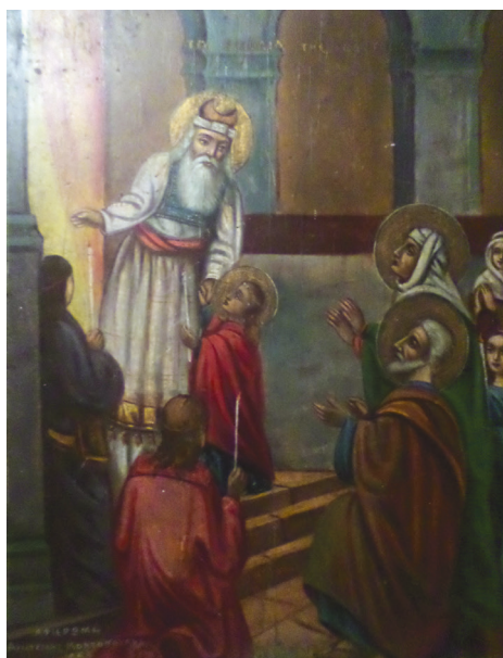
Εικ. 11. Τα Εισόδια της Θεοτόκου.