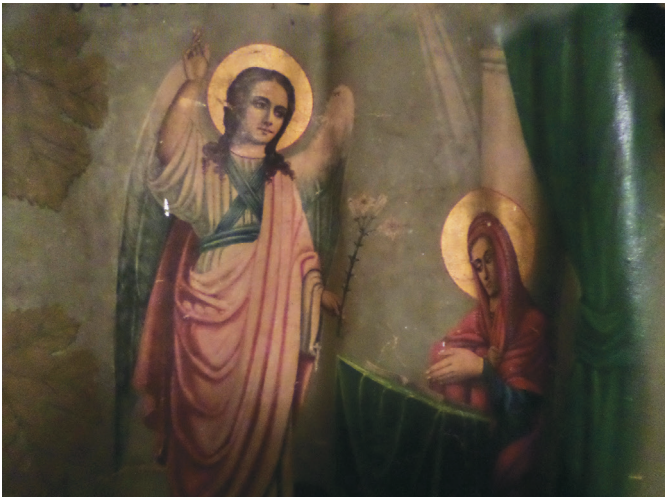
Εικ. 9. Ο Ευαγγελισμός της Θεοτόκου, Λάβαρο.