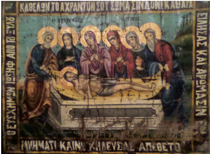
Εικ. 1. Επιτάφιος Μητροπολιτικού Ναού.