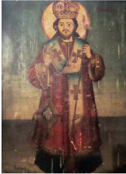
Εικ. 8. Ο Χριστός αρχιερεύς.