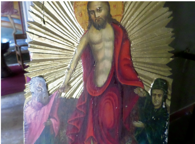
Εικ. 4. Η «εις Άδου κάθοδος» στο Λάβαρο της Μητροπόλεως.