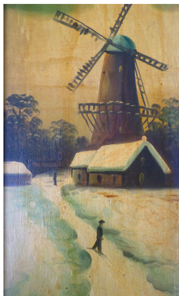
Εικ. 12. Πίνακας, έργο του Παπαγεωργίου 1945.